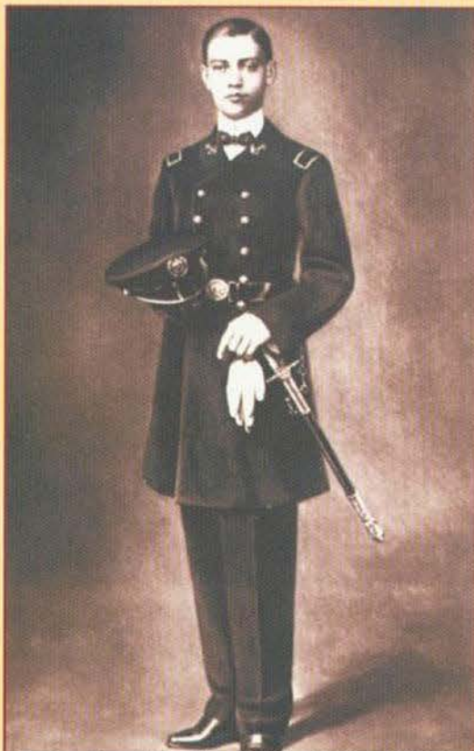
Cuadro del Cadete Virgilio Uribe Robles.

En abril de 1952 sus restos fueron exhumados de un monumento pequeño erigido en el traspatio del hospital Aquiles Serdán en Veracruz, para ser trasladados al monumento que se erigió en honor a los héroes de 1847 y 1914 (Primera y Segunda Intervención Norteamericana respectivamente), localizado en las calles de 16 de septiembre y Arista. Posteriormente se construyó otro monumento que se encuentra situado a un costado de la torre de PEMEX, 14 en el paseo del malecón; en éste se colocaron tres estatuas que corresponden a los héroes navales José Virgilio Uribe Robles, Manuel y José Azueta por lo que surgió la propuesta para que los restos de los citados reposaran en el monumento. Concerniente a los de Virgilio Uribe la gestión inició en marzo de 1991 y sus restos se encuentran ahí desde el 21 de abril de citado año en el que fueron depositados.