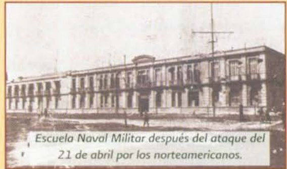
Escuela Naval Militar después del ataque del 21 de abril por los norteamericanos.