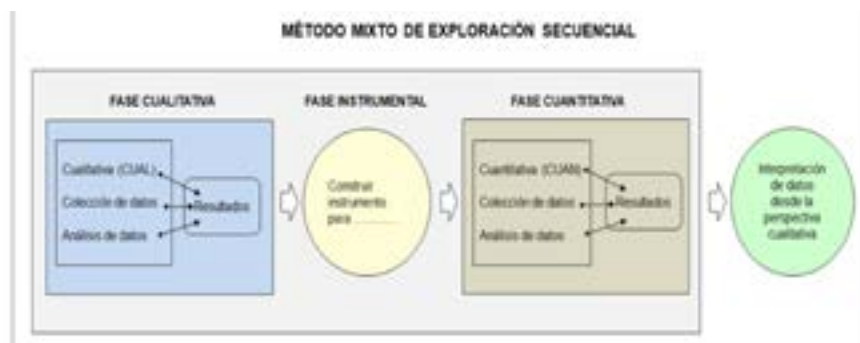
Figura 1: Fases del Método Mixto Exploratorio Secuencial