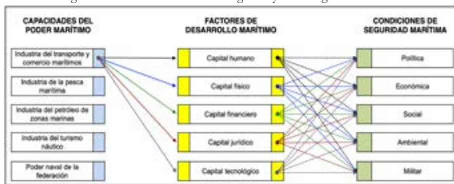
Figura 2. Interrelación entre categorías y subcategorías de análisis

Estas categorías y subcategorías del Desarrollo Marítimo mexicano se interrelacionan entre sí, conformando una red estructural y funcional que afecta o impacta de manera directa o indirecta en el desarrollo de alguna capacidad o intereses del Estado mexicano en el ámbito marítimo. En la figura 2 se muestra la interacción de la subcategoría «Industria del transporte y comercio marítimo» con los factores de Desarrollo Marítimo y las condiciones de Seguridad Marítima. Hay que considerar que, cada una de las capacidades, recursos o intereses que se pretenden desarrollar, presentan la misma dinámica con las otras subcategorías.