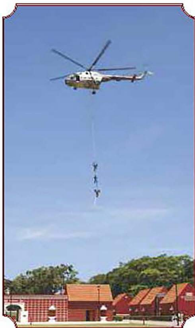
Traslado de los infractores a un lugar seguro, mediante el empleo de la soga para extracción con el helicóptero M127.

Cumplida la misión del aseguramiento del edificio y el rescate de rehenes, un helicóptero Bolkow Super Five sobrevoló el campo de honor llevando a cabo la extracción en racimo del personal y de trasladarlo a la base de operaciones.