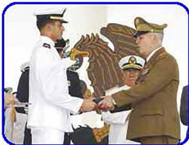
Gobiernos e instituciones militares de otros países, así como autoridades civiles de nuestra nación otorgaron premios y condecoraciones en reconocimiento a los egresados.

Como parte del protocolo, los miembros del presidium hicieron entrega de los sables que distinguen a los Guardiamarinas como Oficiales de la Armada de México ; luego de lo cual los gobiernos e instituciones militares de otros países, así como autoridades civiles de nuestra nación, otorgaron premios y condecoraciones en reconocimiento a los egresados que se distinguieron por su desempeño académico, aptitud para el Mando y dotes de liderazgo, durante su carrera como Cadetes de la Heroica Escuela Naval Militar .