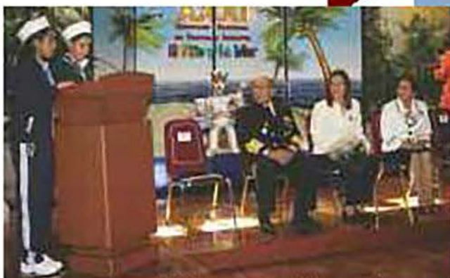
Momentos del discurso pronunciado por niños ganadores agradeciendo a la Secretaría de Marina.