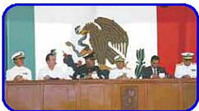
Actividades navales, civiles y militares que durante el acto ocuparon el presidium.

Con los honores de ordenanza al Almirante Mariano Francisco Saynez Mendoza, y al General Guillermo Galván Galván, Secretario de Marina y de Defensa respectivamente, dio inicio la