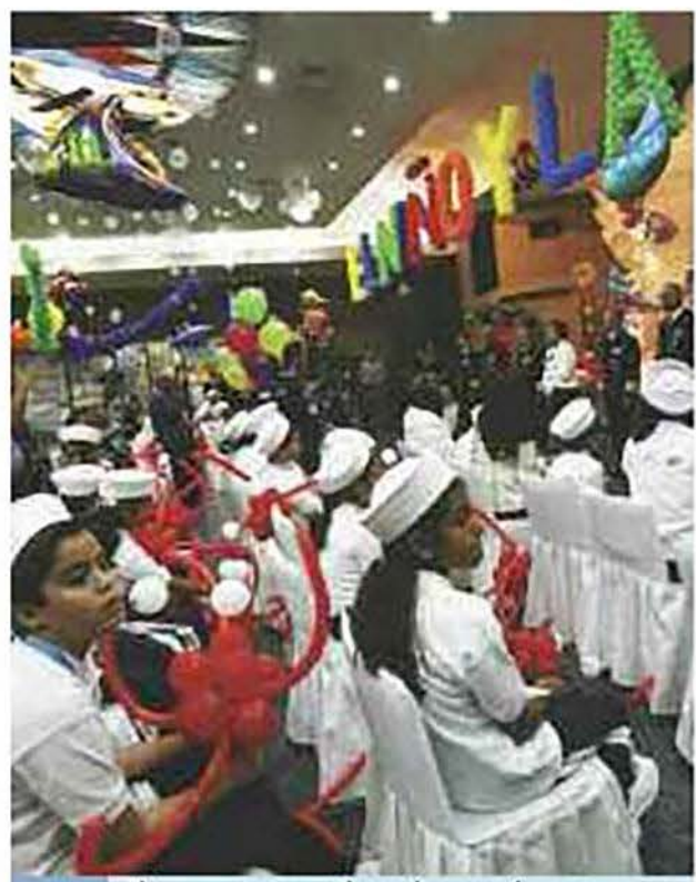
El momento esperado por los ganadores y sus acompañantes, la entrega de premios en las instalaciones del Club Naval Sur.