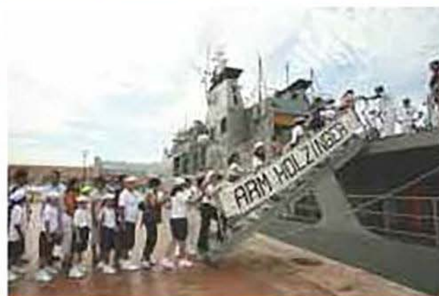
En instalaciones del muelle de la Octava Zona Naval, los ganadores a bordaron con gran entusiasmo el buque ARM Holzinger PO-132.