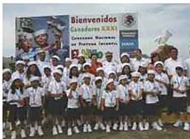
Foto oficial del Concurso el Niño y la Mar.