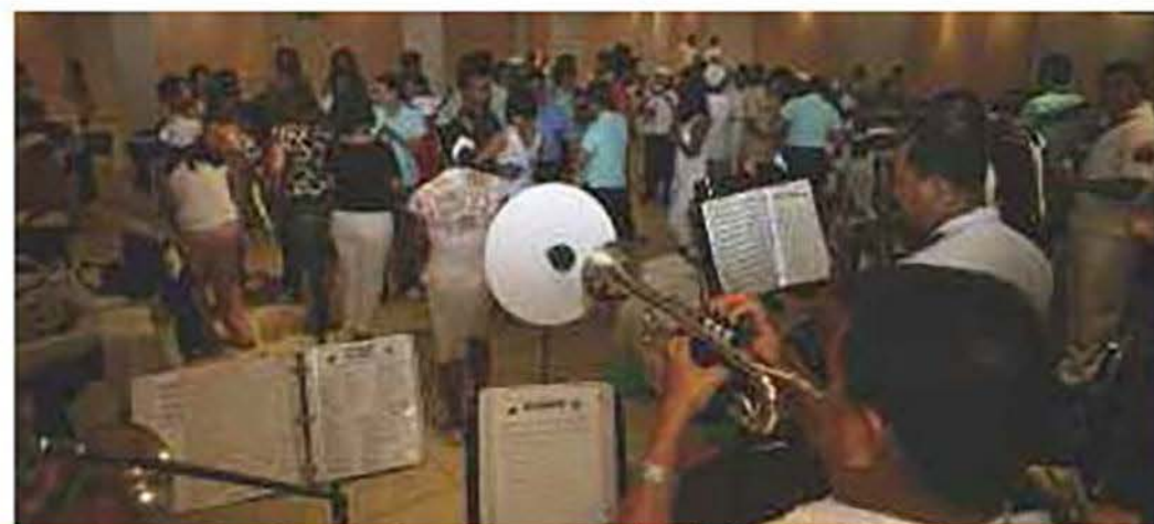
Los ganadores y sus acompañantes disfrutaron los últimos momentos en la aventura del "Niño y la Mar 2008" en la recepción de clausura.