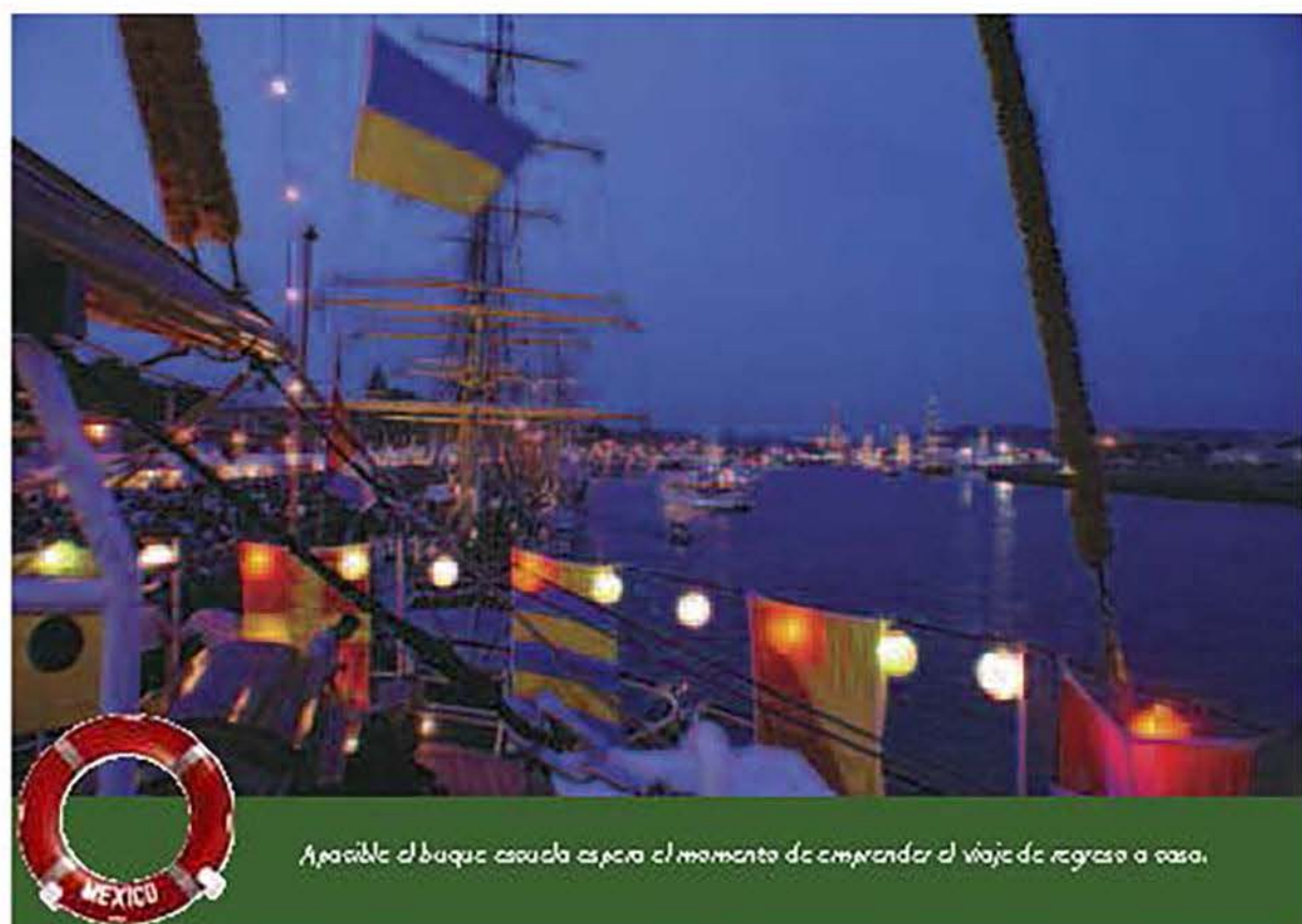
Posible el buque cuando espera el momento de emprender el viaje de regreso a casa.

Biblioteca Pública, la torre en donde estuvo encarcelada Juana de Arco, y que más decir de la hospitalidad y alegría de sus habitantes que siempre tenían un gesto de amistad para la tripulación del ARM Cuauhtémoc BE-01.