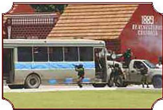
Personal del equipo contra terrorismo de las Fuerzas Especiales, quienes sometieron a supuestos terroristas, asegurando el vehículo con los rehenes.

A lo lejos y sobre el horizonte se pudo observar el lanzamiento de carga logística y viveres con paracaídas redondos y semimaniobrables; además de personal de paracaidistas saltando a 2 mil pies de altura mostrando su habilidad y entrenamiento.