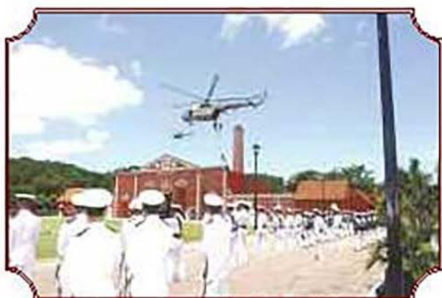
Descenso de personal por medio de soga rápida, utilizando como medio de transporte el helicóptero MI-17.

helicóptero MI-17 sobrevolando a una altura de 5000 pies, desde donde saltó un grupo de Infantes de Marina pertenecientes al Batallón de Infantería de Marina-Fusileros Paracaidistas y a las Fuerzas Especiales del Golfo, mismos que realizaron un ejercicio táctico de paracaidismo de infiltración a gran altura, para ser los precursores de la intervención que momentos más tarde se llevó a cabo en una de las edificaciones de la ex hacienda de Carpizo.