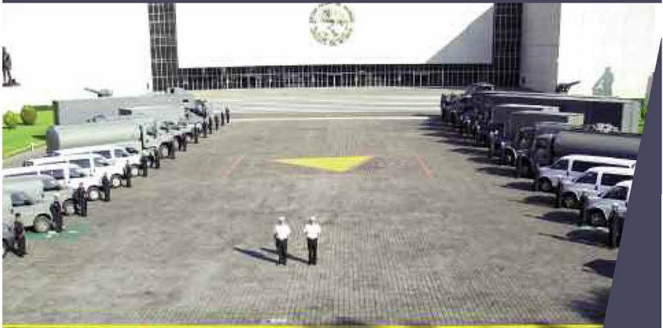
En la primera etapa del Programa de Modernización vehicular fueron adquiridos 29 vehículos de diversos tipos.

Por: Tte. de Corb. SAIN. L. Per. Esperanza DEL TORAL MARTÍNEZ Diseño: 3er. Mtre. SIA. Dib. Enrique REYES RUEDA