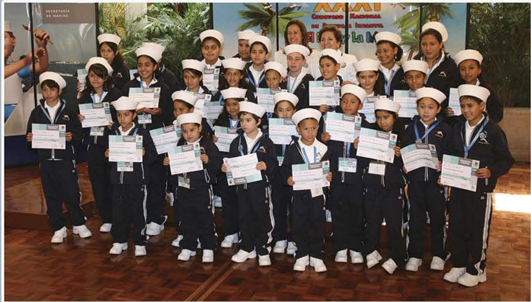
Premiación del XXXI Concurso Nacional de Pintura Infantil "El niño y la mar"