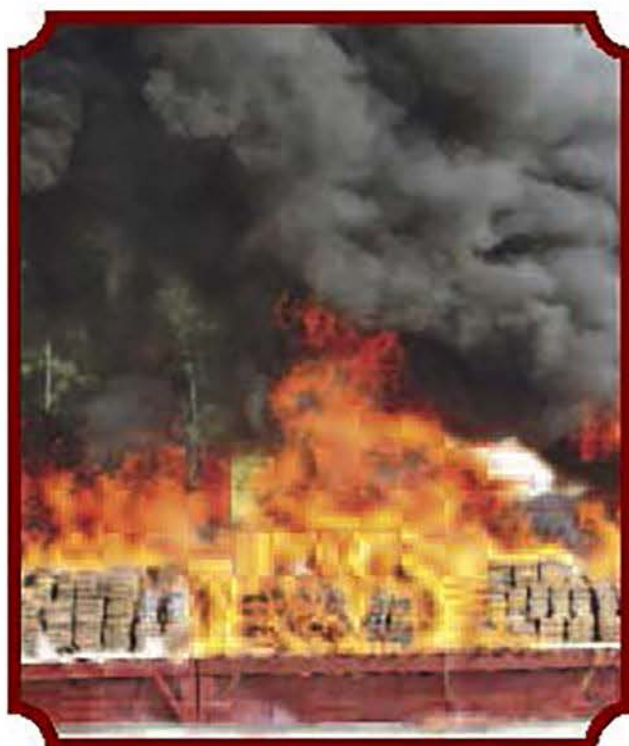
Cerca de seis toneladas de cocaína son reducidas a cenizas

Acto seguido se aseguró la embarcación para que con las medidas de seguridad pertinentes, se procediera a la extracción de los cuatro tripulantes del semisumergible, para ser trasladados a bordo de un helicóptero al Sector Naval de Huatulco para que