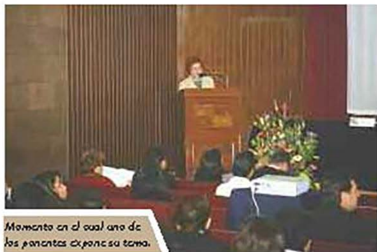
Momento en el cual uno de los ponentes expone su tema.