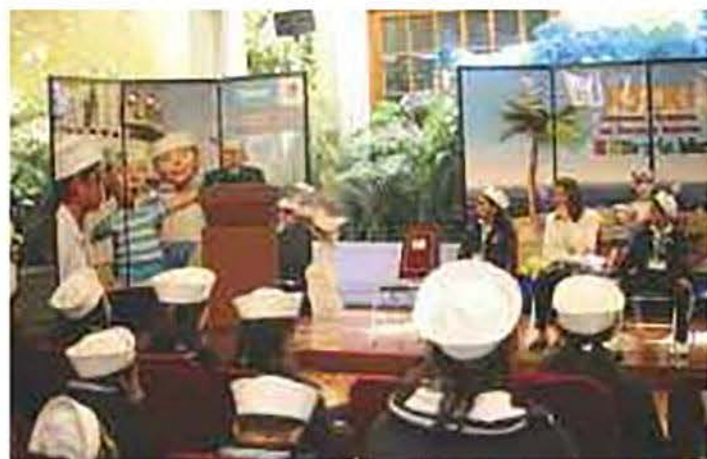
El Secretario de Marina exhortó a los niños a conservar un medio ambiente limpio.