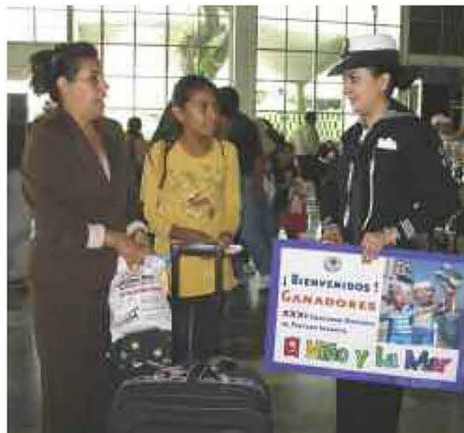
Personal de la institución recibió a los ganadores del “Niño y la Mar”, en las diferentes terminales de autobuses y aérea.

Este año, en el cual se celebró el XXXI aniversario del certamen, la audiencia fue de 1 millón 109 mil 177 pequeños de toda la República Mexicana, entre los seis y 12 años de edad, mostrando con ello su interés de mantener un medio ambiente limpio y lo más sano posible.