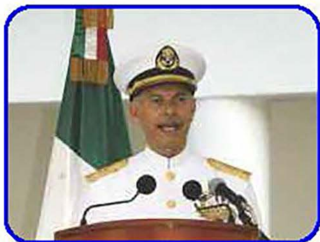
En días próximos comenzará una etapa más en la vida de este glorioso plantel al iniciarse la carrera de logística, integrada por Cadetes de ambos sexos: Vicealmirante Colina Torres.

En este tono de ideas anunció: "En días próximos comenzará una etapa más en la vida de este glorioso plantel al iniciarse la carrera de logística, integrada por Cadetes de ambos sexos; razón por la cual y como parte de la remodelación de los dormitorios y salones de clases se ha terminado la primera etapa de la construcción del dormitorio de mujeres que albergará a las primeras Cadetes femeninas".