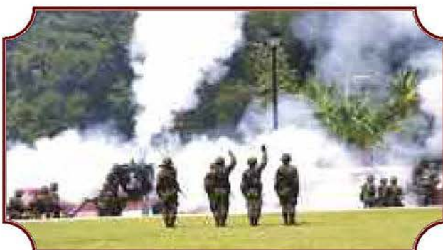
En las instalaciones del CENCAEIM fueron rendidos los correspondientes honores de ordenanza al Alto Mando de la Armada de México.

Dicho acto que tuvo verificativo en las instalaciones del Centro de Capacitación y Adiestramiento Especializado de Infantería de Marina (CENCAEIM) , ubicado en la ex hacienda de San Luis Carpizo, constituye el primer escalón de la vida profesional de los Oficiales egresados, quienes luego de una preparación que comprendió un periodo de tres años en la Escuela de Infantería de Marina, obtuvieron el grado de Primer Maestre, para posteriormente ser comisionados durante un año en los diferentes Batallones con el fin de realizar prácticas profesionales y al concluir las presentar su examen profesional que les permita obtener el grado inmediato superior.