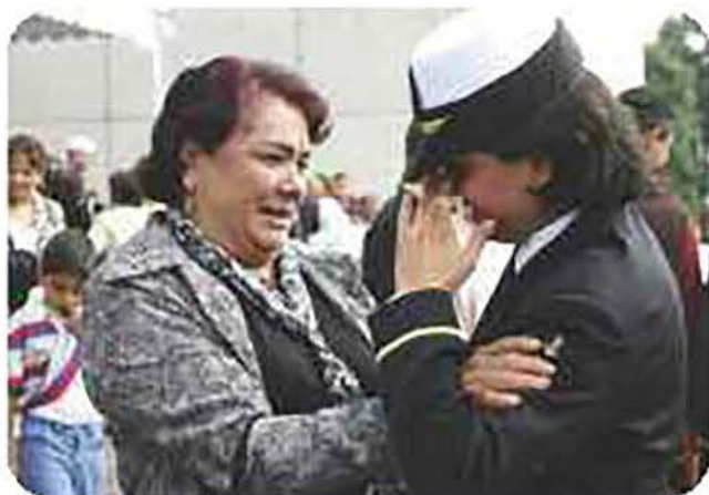
Con gran emoción los familiares felicitan a los graduados.