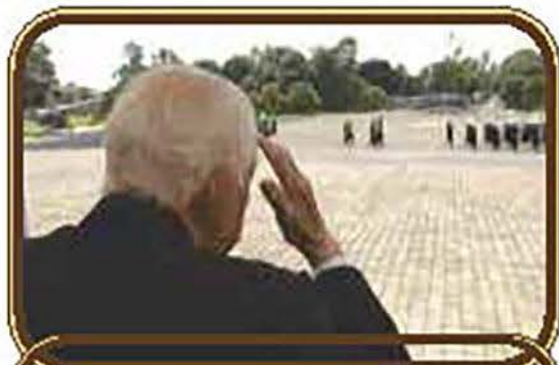
La columna de honores desfila ante el presidium, haciendo gala de marcialidad y gallardía.