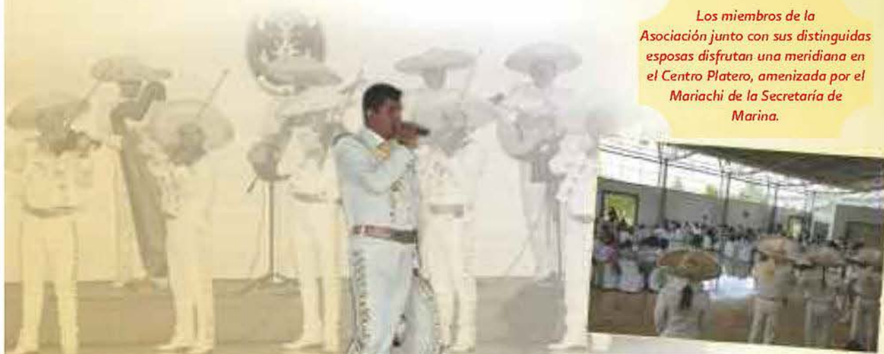
Los miembros de la Asociación junto con sus distinguidas esposas disfrutaron una meridiana en el Centro Platero, amenizada por el Mariachi de la Secretaría de Marina.