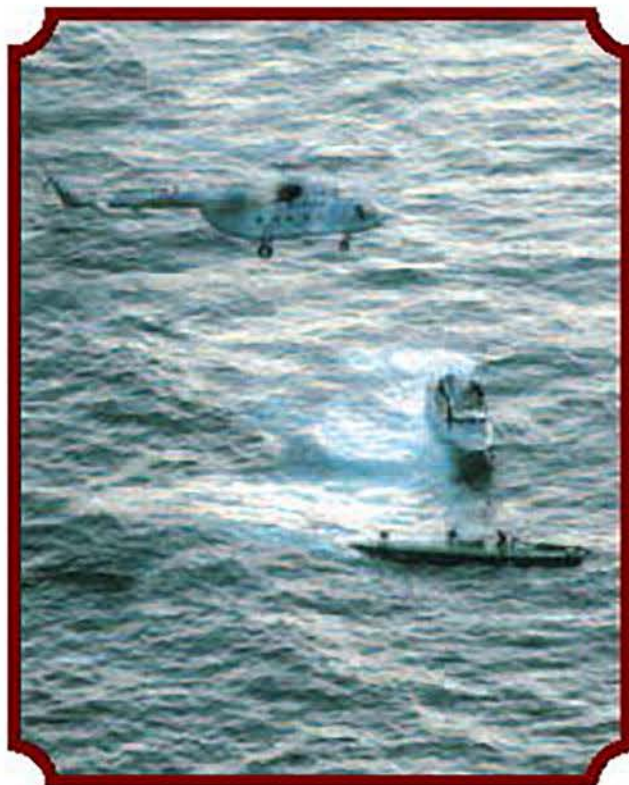
Momento de la intercepción del semisumergible