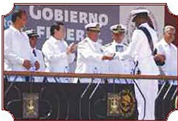
Alumnos con las más altas calificaciones recibieron diplomas y obsequios por parte de los miembros del presidium.