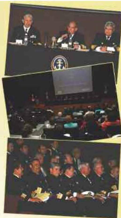
En el Palacio de Justicia se realizó la sesión de trabajo de los Cadetes de la Asociación de la Heroica Escuela Naval Militar.

En tanto, las distinguidas esposas e invitados especiales realizaron un recorrido por el museo "Rafael Coronel" y por el Centro Platero, lugar al que más tarde los "Cadetes" se unieron para disfrutar de una deliciosa "meridiana" con