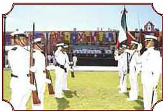
Relievo de escoltas, en el que los Oficiales graduados entregaron la Bandera de Guerra a los alumnos del tercer año.

Con los correspondientes honores de ordenanza rendidos al Alto Mando de la Armada de México dio inicio la ceremonia donde los alumnos que obtuvieron las más altas calificaciones durante el ciclo lectivo 2007-2008, recibieron diplomas y obsequios por parte de los miembros del presidium; antecediendo el relevo de escoltas, en el que los Oficiales graduados entregaron la Bandera de Guerra del CENCAEIM a los alumnos del tercer año quienes a partir del momento adquirieron la alta responsabilidad y honor de custodiarla y defenderla.