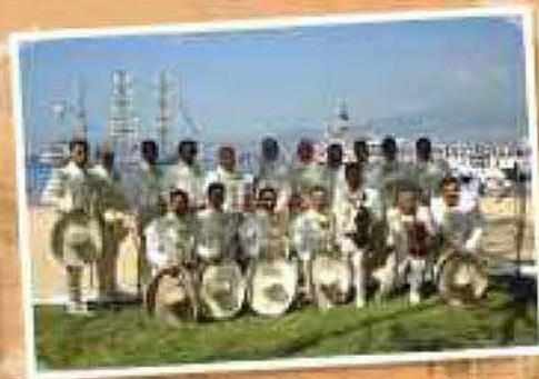
Aspectos diversos de las actividades del Mariachi durante su estancia en España.

Evento en el que la Secretaría de Marina-Armada de México , también hizo acto de presencia cultural, a través de su Mariachi, el cual fue el encargado de recibir con música mexicana al Presidente de los Estados Unidos Mexicanos, Felipe Calderón Hinojosa, a su arribo al pabellón en la Expo-Zaragoza 2008.