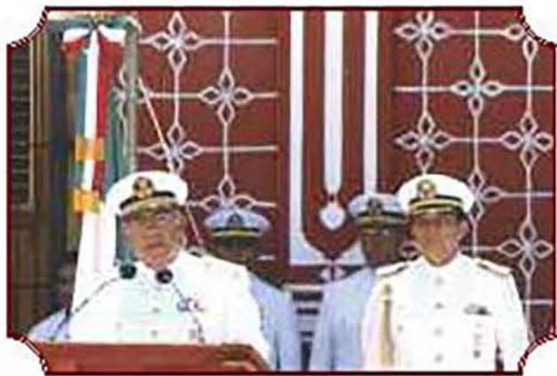
Momentos en los que pronuncia su discurso el Alto Mando de la Armada de México Almirante Mariano Francisco Saynez Mendoza

Además mencionó que con la graduación de estos jóvenes la Institución da un paso más en el reto de contar con una Armada organizada, equipada y entrenada para prevenir y neutralizar cualquier amenaza externa o interna, toda vez que