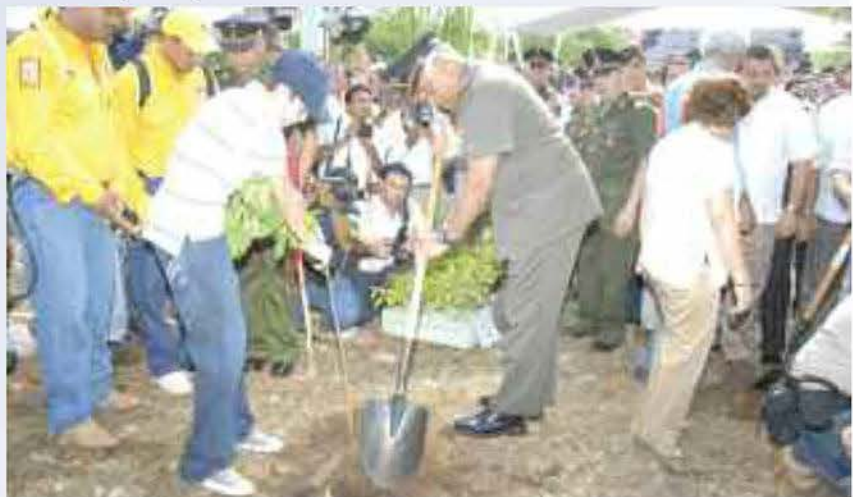
Con apoyo de la sociedad-civil la Campaña de Reforestación fue un éxito.

En el mes de julio de 2007 los titulares de las Secretarías de la Defensa Nacional, del Medio Ambiente y de la Comisión Nacional Forestal signaron el documento denominado "bases de colaboración para la