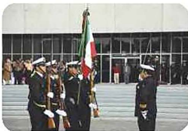
Durante la Ceremonia de Graduación, se realizó el relevo de escoltas, el personal de graduados cedió la Bandera a los alumnos de quinto año.

Una vez más se dio cumplimiento a los objetivos encomendados a la Secretaría de Marina: la formación, capacitación y especialización de su personal, como punto fundamental para el logro de la misión, y el de la preservación de la salud del personal naval y de sus derechohabientes.