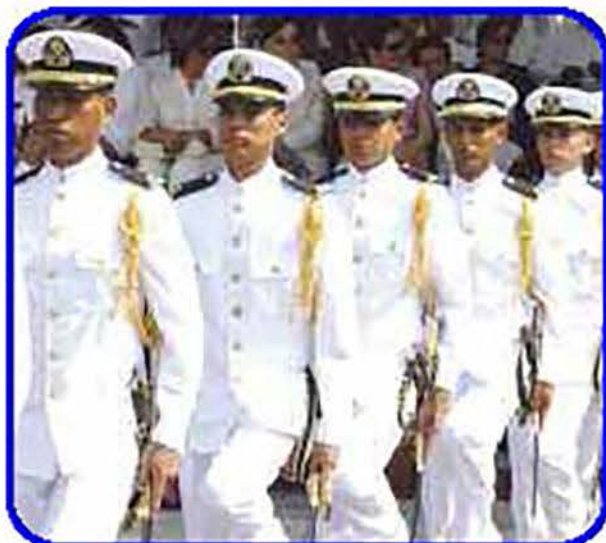
El sable distingue a los Guardiamarinas como Oficiales de la Armada de México.

Además de felicitar a todos los padres o tutores del personal graduado también se dirigió a