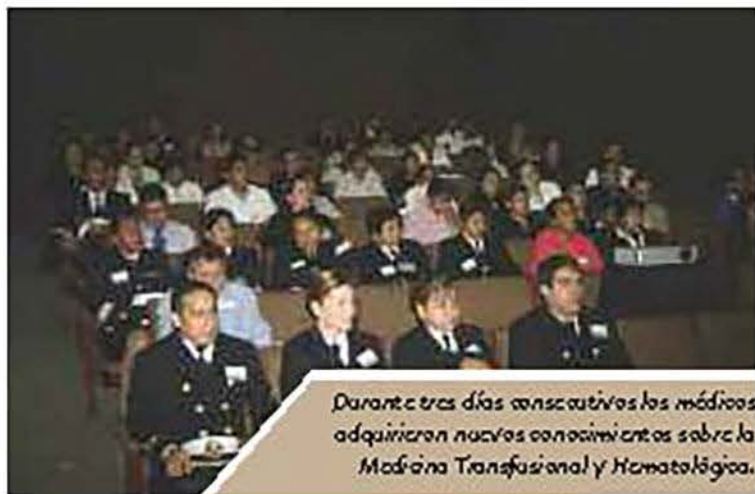
Durante tres días consecutivos los médicos adquirieron nuevos conocimientos sobre la Medicina Transfusional y Hematología.