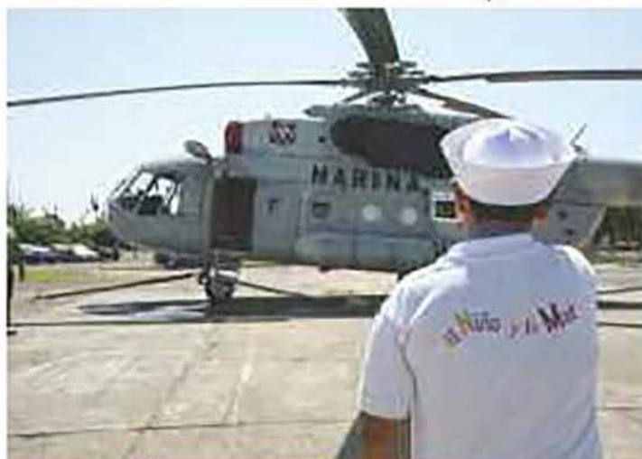
Visita de los ganadores a las instalaciones de la Base Aeronaval en Veracruz.

El día 24, visitaron el Sea Life Park, Vallarta Dolphin Discovery, en donde se regocijaron en las albercas y áreas verdes, así como con el show de lobos marinos y el nado con delfines, para después regresar al hotel y esperar con ansiedad la partida al puerto de Veracruz.