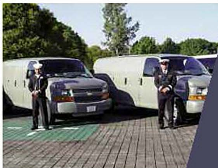
Al modernizar su parque vehicular la Armada de México está en capacidad de hacer frente a los retos que actualmente se presentan.

De la misma manera, este programa le permitirá a la Armada de México proporcionar los requerimientos necesarios a establecimientos navales ubicados en todo el territorio nacional, bases logísticas de las unidades operativas (buques, aeronaves y vehículos); considerando también que al modernizar su parque vehicular la Institución sumará esfuerzos para hacer frente a los retos actuales que representan el narcotráfico, la pesca ilegal, el tráfico ilegal de personas y los grupos terroristas, para lo cual es necesario contar con vehículos modernos capaces de cubrir en tiempo y forma las necesidades logísticas de las unidades operativas para que puedan cumplir su misión.