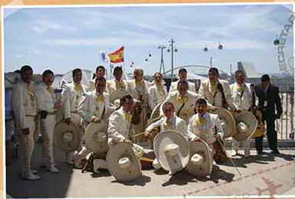
Presencia del Mariachi de la Secretaría de Marina en la "Expo-Zaragoza 2008"