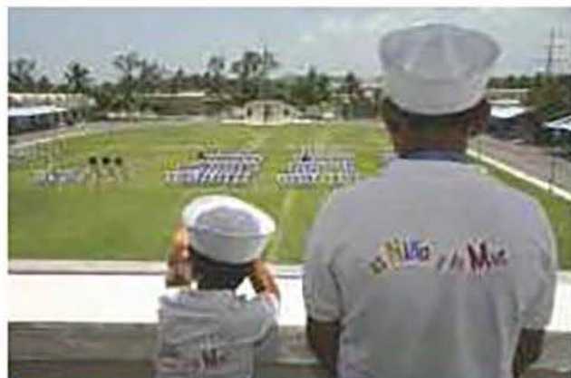
En Antón Lizardo, Veracruz, disfrutaron de un recorrido en compañía de cadetes en las instalaciones de la Heroica Escuela Naval Militar.