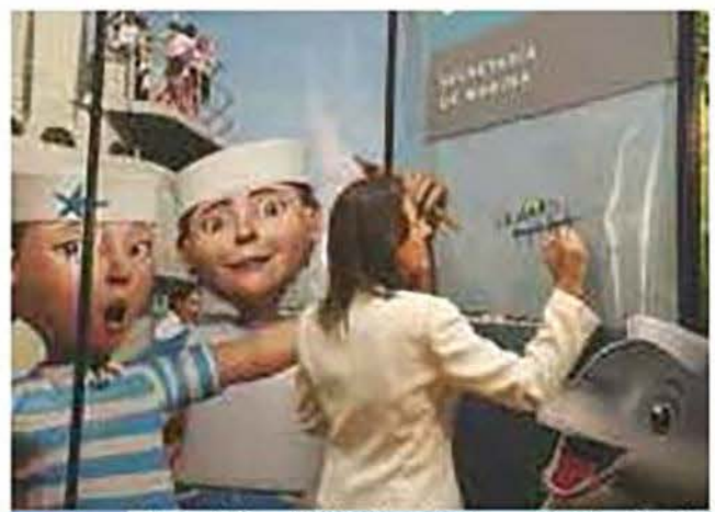
Firma del cartel del Niño y la Mar por la licenciada Margarita Zavala y el Secretario de Marina, Almirante Mariano Francisco Sayncz Mendoza.