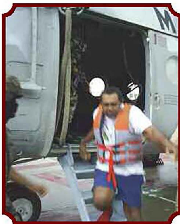
La pronta y eficaz acción de los elementos de Infantería de Marina permitió el aseguramiento de los infractores de la ley.