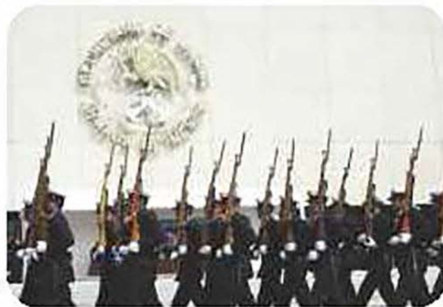
El personal de alumnos de la Escuela Médico Naval desfilaron y pasaron revista con la disciplina, gallardía y marcialidad que los caracteriza.