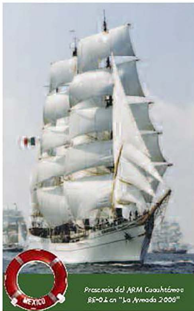
Presencia del ARM Cuauhtémoc BE-01 en "La Armada 2000"

se dieron cita en el muelle de Rouen para hacernos sentir la más cálida de las despedidas.