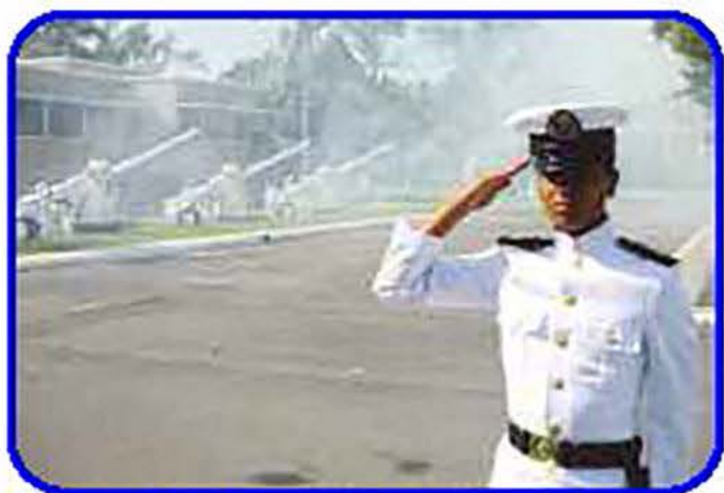
Durante el acto se recordó a los héroes caídos el 21 de abril de 1914, y el 13 de septiembre de 1847, quienes ofrendaron sus vidas en la defensa de nuestra Patria.

Durante el acto se recordó a los héroes caídos el 21 de abril de 1914, y el 13 de septiembre de 1847, quienes ofrendaron sus vidas en la defensa de nuestra Patria, de tal manera que el Almirante Secretario de Marina, dio lectura a la lista de héroes de la HERON y del Heroico Colegio Militar, seguido por un Toque de Silencio de la Banda de Guerra y una Salva de Fusilería ejecutada por las Brigadas del Cuerpo de Cadetes.