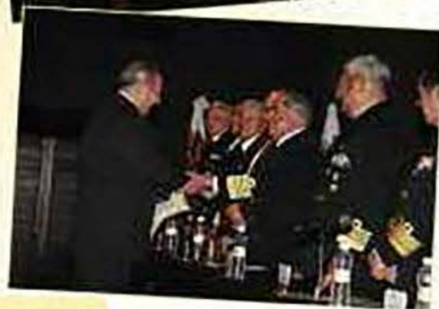
El Secretario de Marina junto con altos directivos de la Asociación y representantes del gobierno Zacatecano fueron los encargados de entregar los premios a los ganadores.

Categoría "A" Prosa, mismo orden, "Cantos Marineros: las Edades del Hombre", "Carta en el mar" y "El hombre y el mar". Categoría "B" poesía: "Mi velero", "Me sumerjo en ti". Categoría "B" prosa: "El Contra maestre", "El vaquero playero" y "Deseo cumplido".