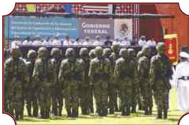
Almirante Secretario de Marina acompañado de los miembros del presidium, durante la ceremonia de graduación.

E l pasado 8 de agosto desde Champotón, Campeche, mítico lugar que por tradición popular se le atribuye el significado de Bahía de la Mala Pelea, por ser el sitio donde las fuerzas conquistadoras españolas fueron derrotadas por los ejércitos mayas, se llevó a cabo la ceremonia de graduación de 26 integrantes de la sexta generación de Oficiales Técnico-Profesionales de Infantería de Marina, acto que estuvo presidido por el Secretario de Marina, Almirante Mariano Francisco Saynez Mendoza, quien estuvo acompañado en el presidium, entre otras personalidades del ámbito civil, naval y militar, por el Gobernador del Estado de Campeche, Contador Público Jorge Carlos Hurtado Valdez.