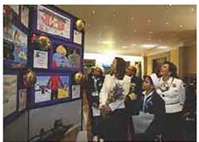
Recorrido por la exposición de las pinturas ganadoras del concurso.

Para continuar la fiesta, por la tarde, abordaron el Turibus que los llevaría a un recorrido por las principales avenidas arquitectónicas y de gran tradición en el Centro Histórico de la Ciudad.