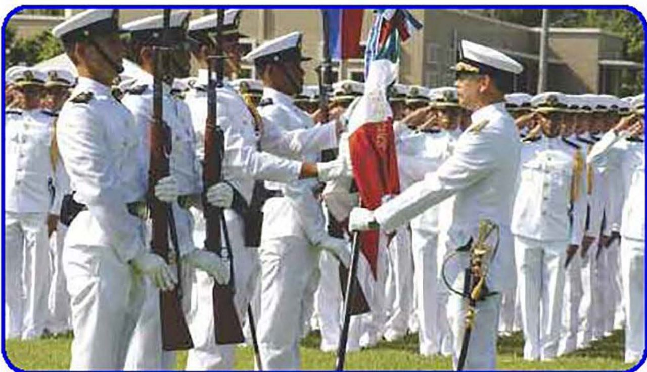
Relevo de escoltas en el que se deposita la Bandera de Guerra del plantel en manos de Escoltas de la HENM.