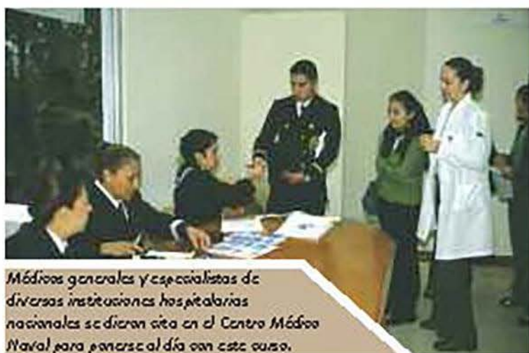
Médicos generales y especialistas de diversas instituciones hospitalarias nacionales se dieron cita en el Centro Médico Naval para ponerse al día con este curso.

Fue así como en este séptimo encuentro de especialistas en Medicina Transfusional y Hematología, organizado por los médicos de la Armada de México con la participación profesional de las distintas instituciones hospitalarias que proveyeron aportaciones del conocimiento y experiencia, se llegó a resultados valiosos en beneficio de la salud de la población mexicana en este renglón.