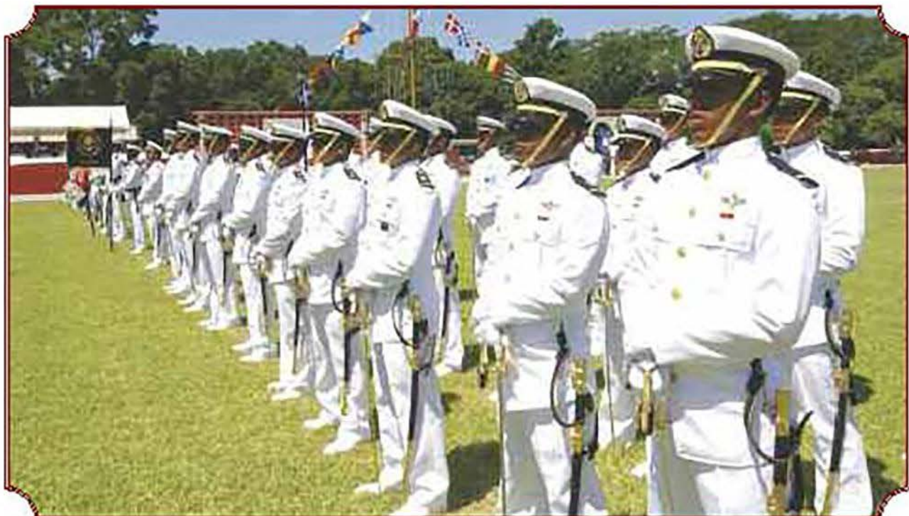
Cada uno de los integrantes de la sexta generación de Infantería de Marina recibió su sable de mando.

Cabe anotar que se trata de la penúltima generación de mencionada Escuela, ya que como parte de uno de los cambios efectuados en la presente administración, la formación de profesionales de Infantería fue transferida a la Heroica Escuela Naval Militar, de tal manera que a partir del 1° de junio del 2007 la ex hacienda de Carpizo alberga el Centro de Capacitación, con la misión de preparar al personal de Infantería de Marina en los niveles de especialización y capacitación.