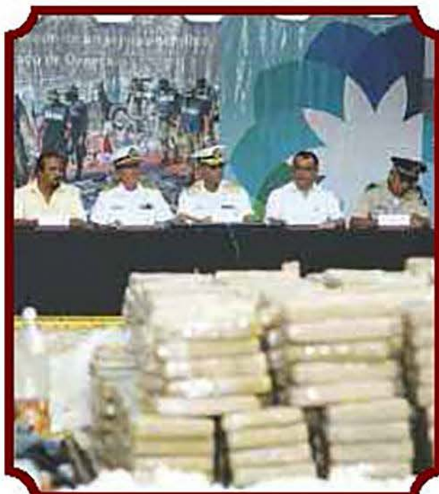
Aspecto de la ceremonia de incineración de la droga decomisada.

personal médico del Sanatorio Naval certificara su estado de salud.