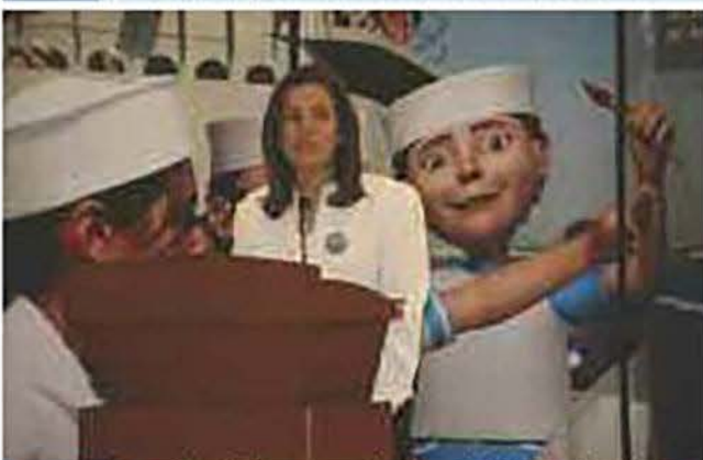
La Licenciada Margarita Zavala felicitó a los niños ganadores por sus dibujos.