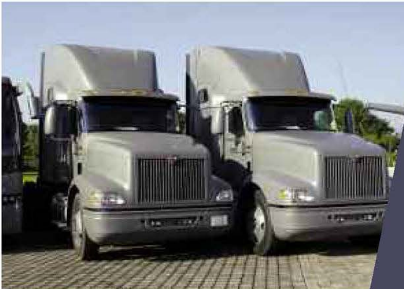
Se tiene contemplado adquirir un total de 352 unidades, a fin de mantener activo y en movimiento constante el tren logístico de la Institución.

29 vehículos de diversos tipos, los cuales forman parte de un total de 352 unidades contempladas.