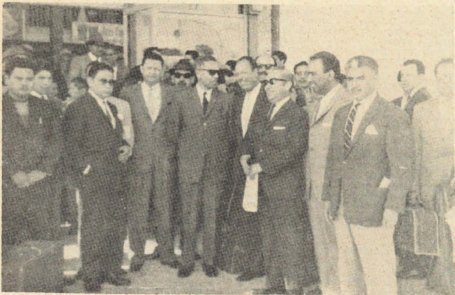
LOS DELEGADOS AL CONGRESO CELEBRADO PARA LA CREACION DEL SINDICATO NACIONAL DE TRABAJADORES DEL I.S.S.S.T.E., SON RECIBIDOS EN GUADALAJARA, JAL., PARA LA CONTINUACION DE SUS IMPORTANTES LABORES.