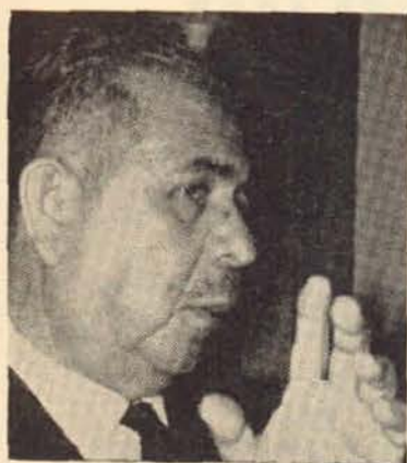
Gral. Lázaro Cárdenas

La Revolución de 1910 vino a consolidar la nueva política nacional a través de grandes sacrificios de las clases populares, que dirigidas por nuestros grandes hombres estadistas y revolucionarios, destruyeron el poder caduco cuya bandera amparaba a los capitalistas, nacionales y extranjeros, que explotaban a las clases obreras y campesinas;