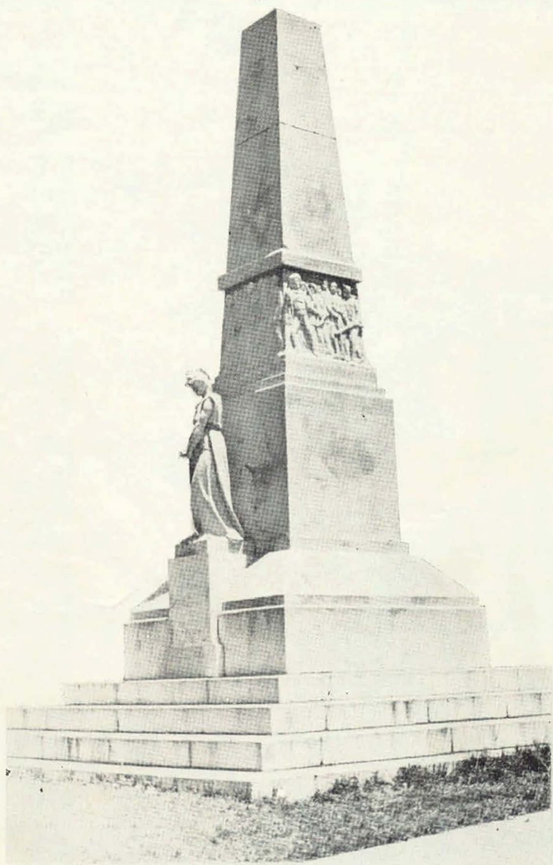
El pueblo mexicano recordará siempre, con sus anhelos de libertad, que los hijos de la H. Escuela Naval de Veracruz repelieron a los invasores del 21 de abril de 1914, con las armas que tuvieron a su alcance, y con todo su corazón, que ofrendaron a la patria hasta caer sin vida.