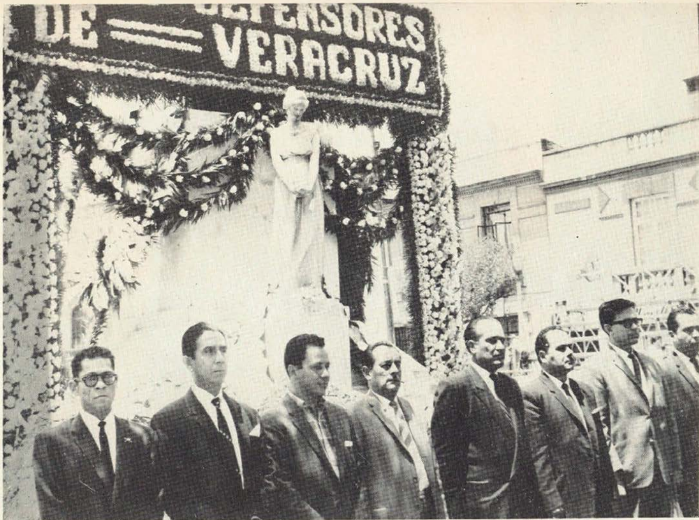
El 21 de abril del presente año, compañeros del Comité Ejecutivo Nacional y Comisiones Permanentes del Sindicato Nacional de Trabajadores de la Secretaría de Marina, montaron guardia en el Monumento a los Defensores de Veracruz, que se encuentra en esta ciudad, en las calles de Veracruz y Cuernavaca.