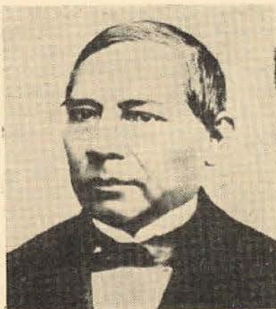
Lic. don Benito Juárez Benemérito de las Américas

Toda esta trayectoria, que recordada retrospectivamente se mira para engrandecer la figura de Juárez, que nunca será bien colmado con los honores que merece, vista hacia el presente es para concluir con pensamiento sereno, de que el bienestar social y