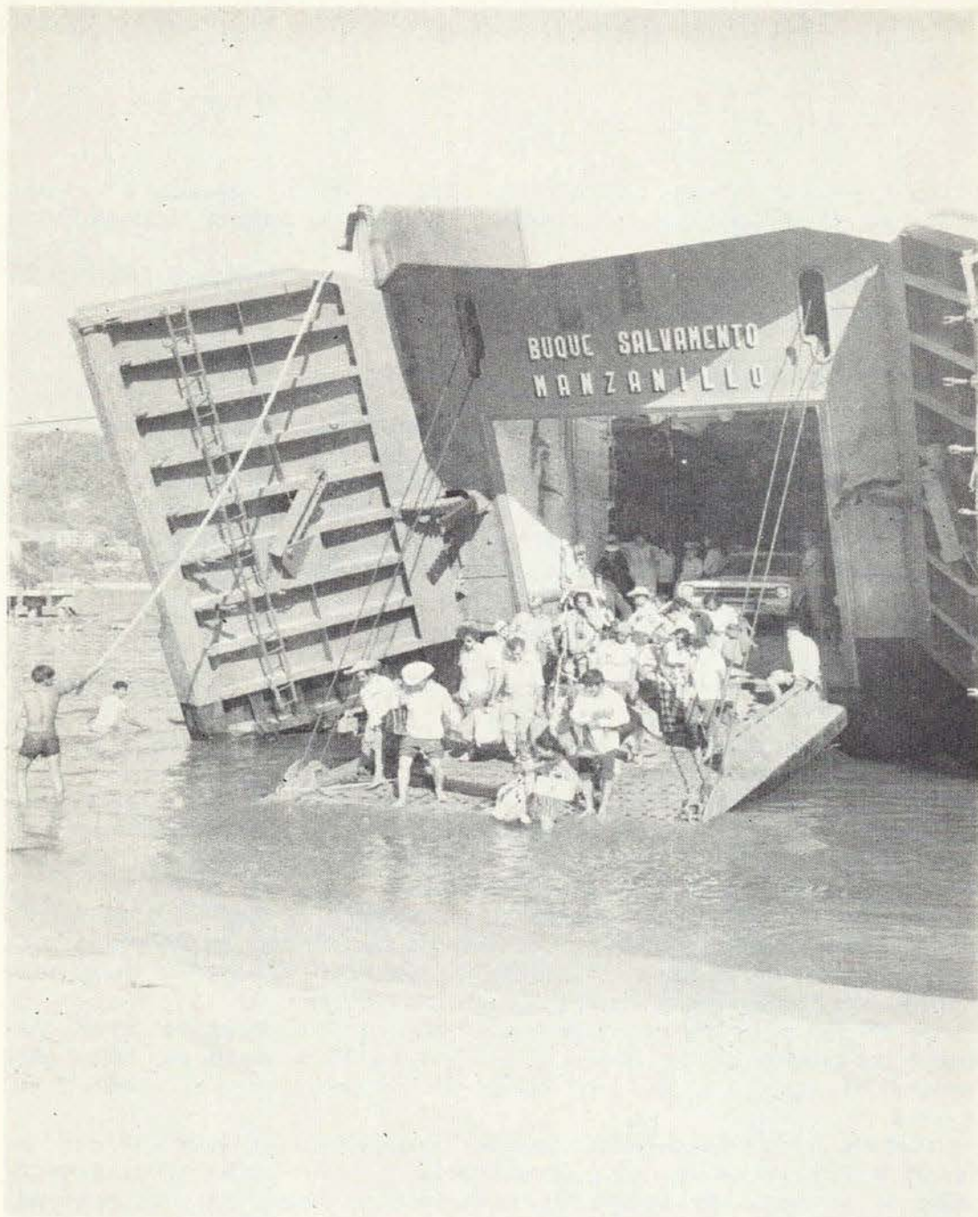
Importante labor social desarrolla la Armada de México, tendiente a prestar ayuda a la población civil cuando ésta lo requiere.