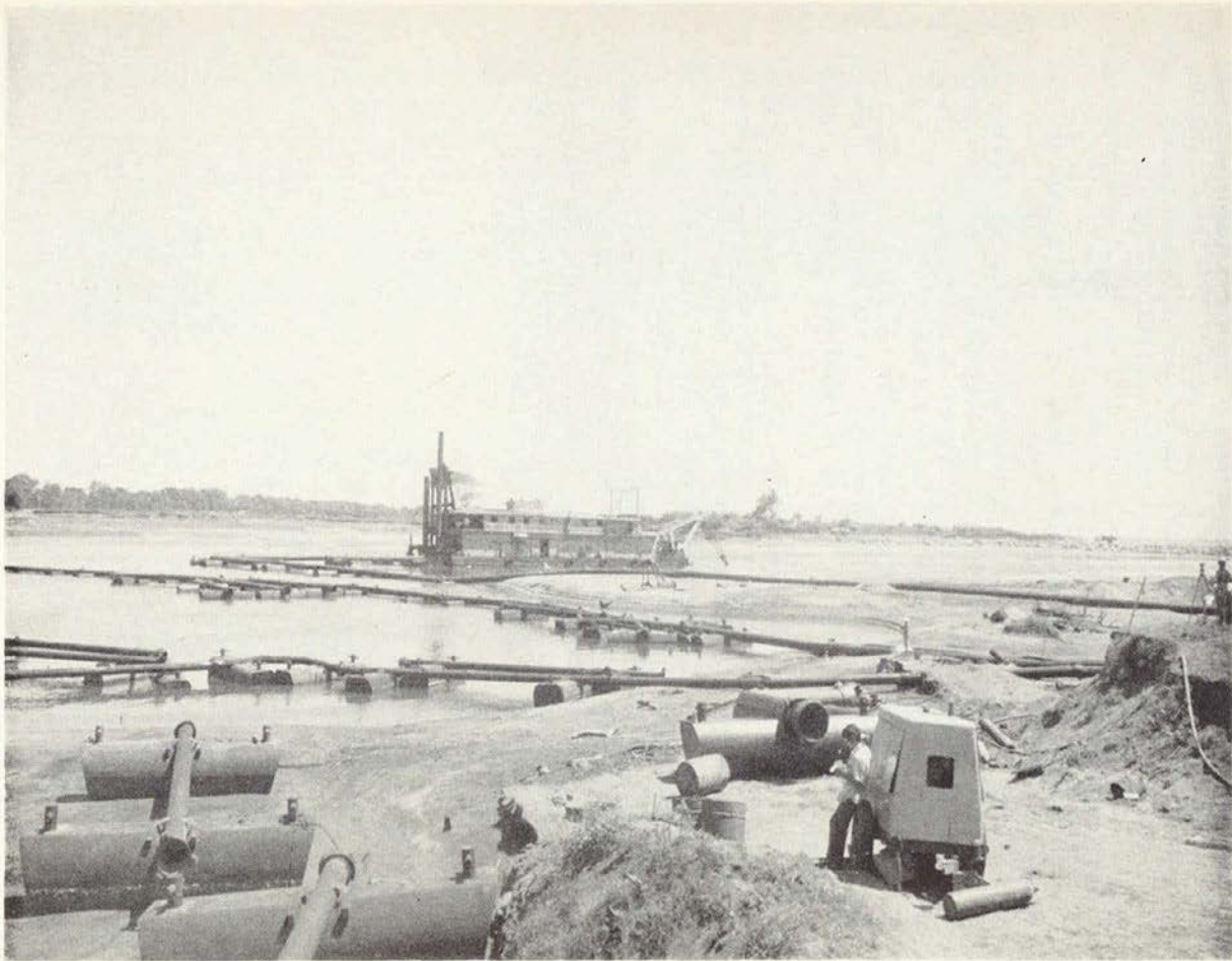
Obras de dragado interior se realizan en Puerto Madero con el fin de mantener la profundidad necesaria para sus operaciones.