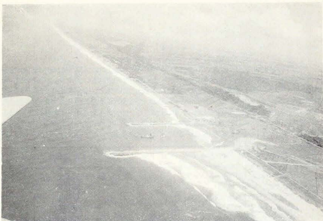
El Puerto Lázaro Cárdenas es una de las obras que fortalece la infraestructura portuaria del país, a la cual el actual régimen le ha dado atención preferente.