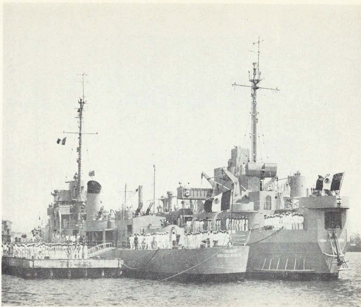
El buque-escuela Manuel Azueta y el buque-escuela Vicente Guerrero fueron adquiridos recientemente por la Armada de México, y están destinados a los viajes de prácticas de los alumnos de la H. Escuela Naval.