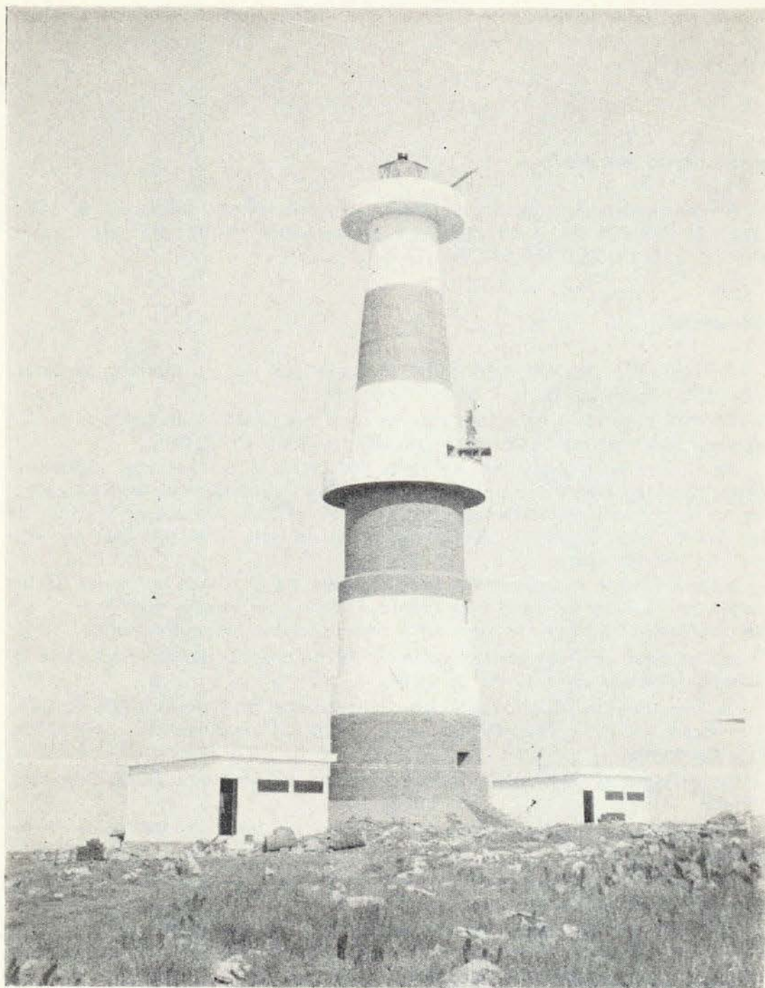
El señalamiento marítimo contribuye a que el tráfico de barcos se realice con la seguridad necesaria, por ello se realiza una permanente labor en el mantenimiento de los faros.