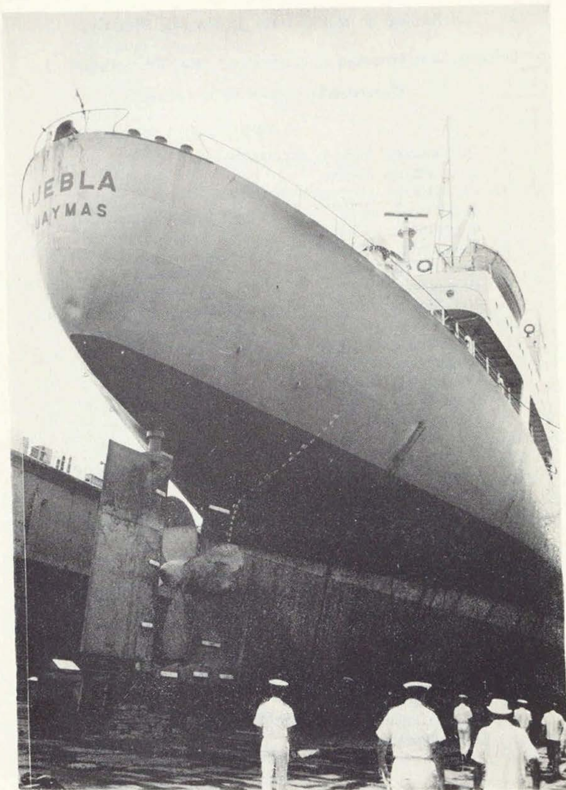
En los astilleros nacionales fueron reparados buques de gran calado que anteriormente tenían que ser enviados al extranjero para tal fin.