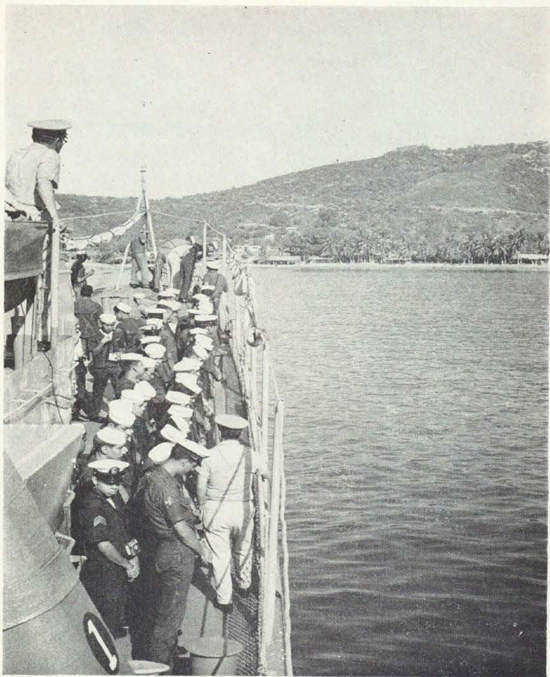
Jóvenes conscriptos de infantería de marina reciben la instrucción correspondiente a las labores de vigilancia que realizan los buques de la Armada de México.