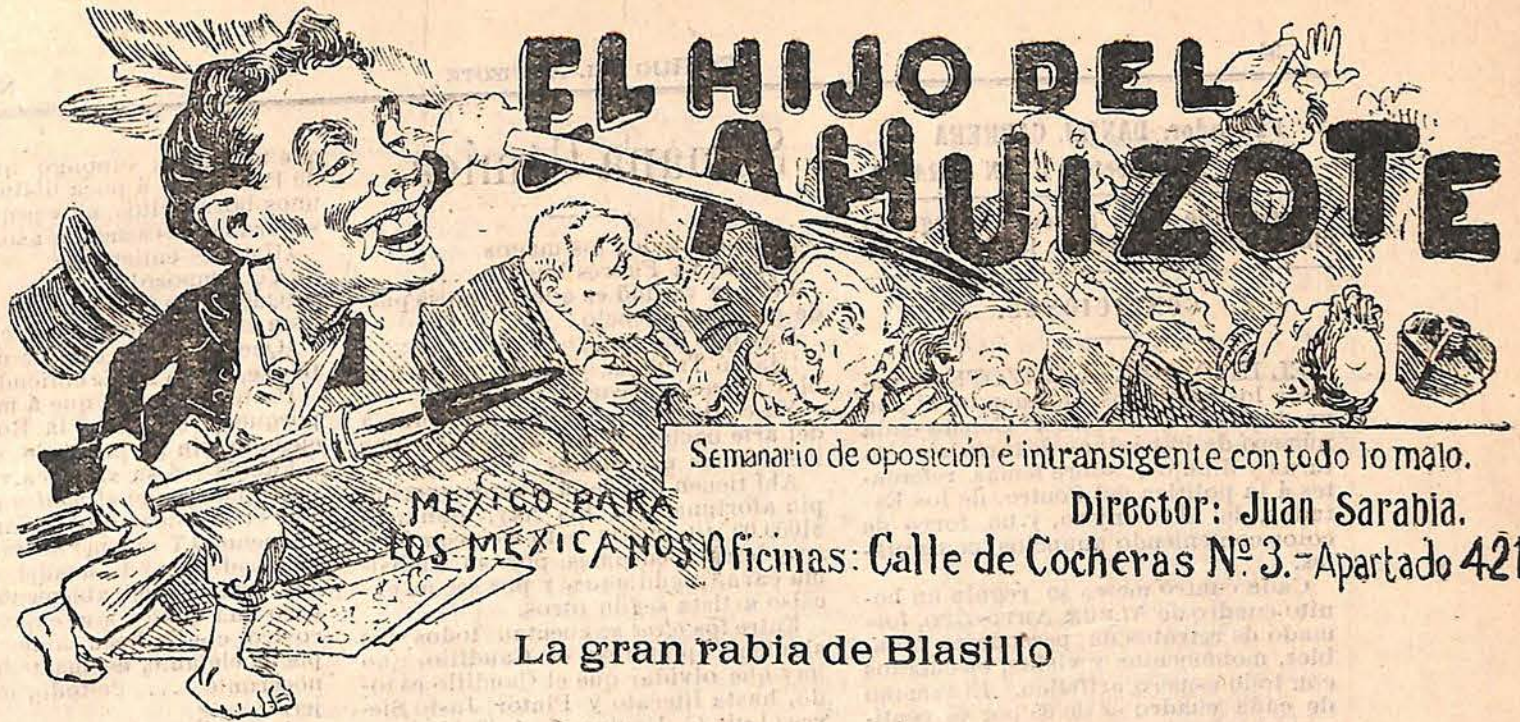
La gran rabia de Blasillo