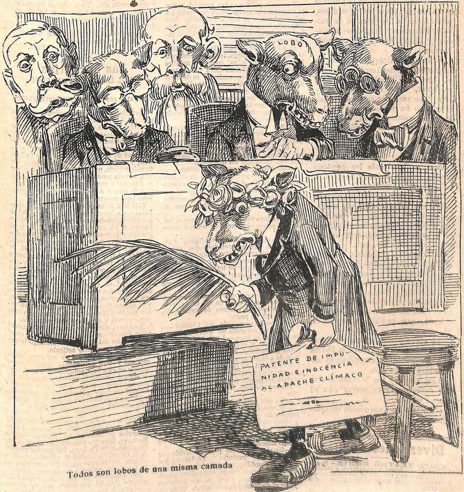
Todos son lobos de una misma camada