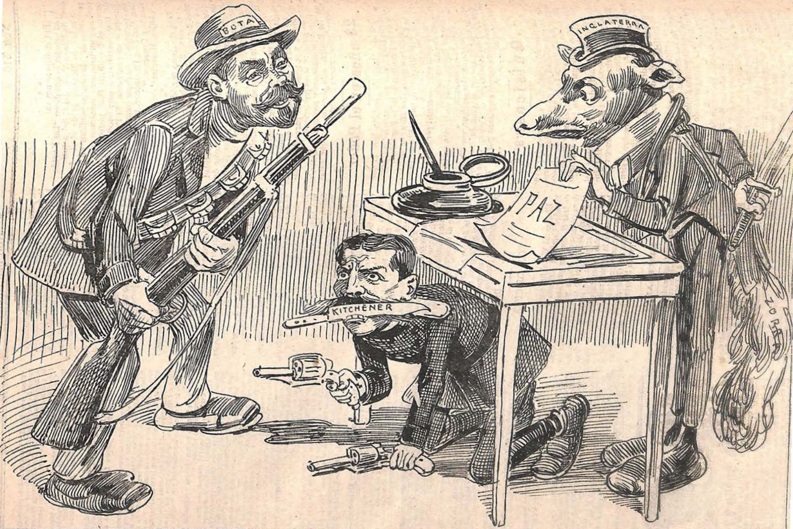
La pérfida Albión. — Te brindo la paz ¡ Ven á firmar ! El Boer ¡ Firma tú primero. ¡ El bello sexo por delante!