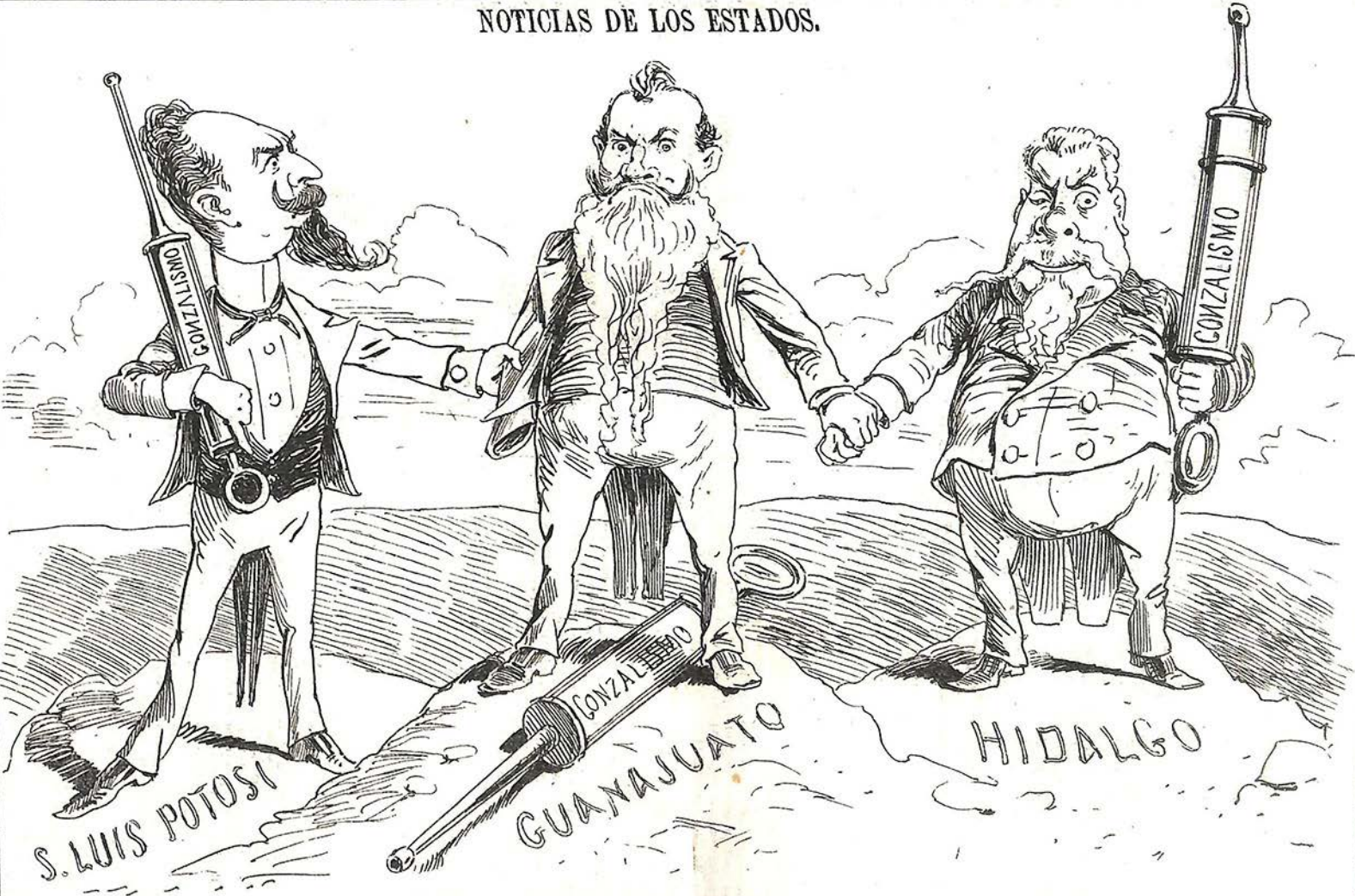
La Triple Alianza.