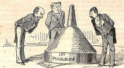
¡Se salvó la nación! Pero debajo del embudo quedó sonando una voz que gritaba como el candelero..... ¡quitenmelo que me ahogo!.