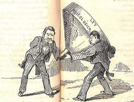
Dia-zofir recomendándole lo angosto