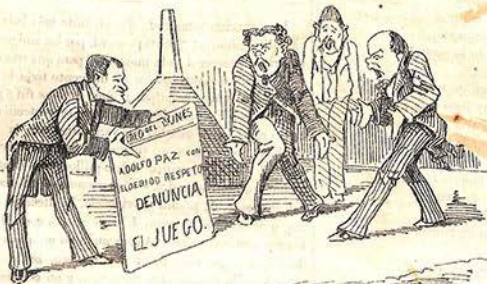
Pero surge un contratiempo... ¡oh posicion difícil! (no para el embudo)