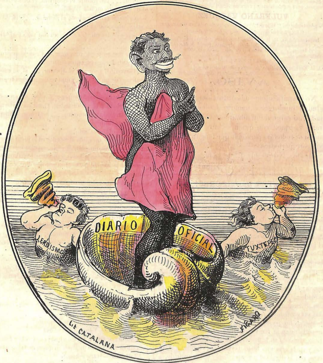
CAMAFEO ANTIGUO GUARDADO EN EL PALACIO NACIONAL.