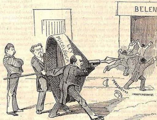
Fué debidamente utilizado con un aditamento.