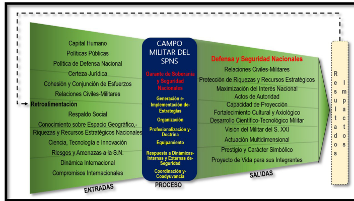
Ilustración 6. Gráfica del Proceso del Campo Militar del Sistema del Poder Nacional Sostenible