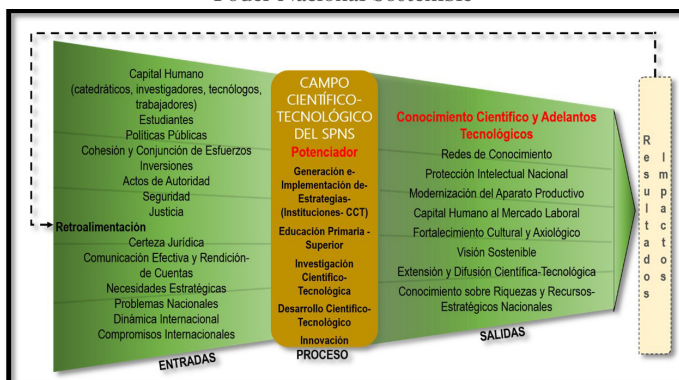
Ilustración 5. Gráfica del Proceso del Campo Científico-Tecnológico del Sistema del Poder Nacional Sostenible