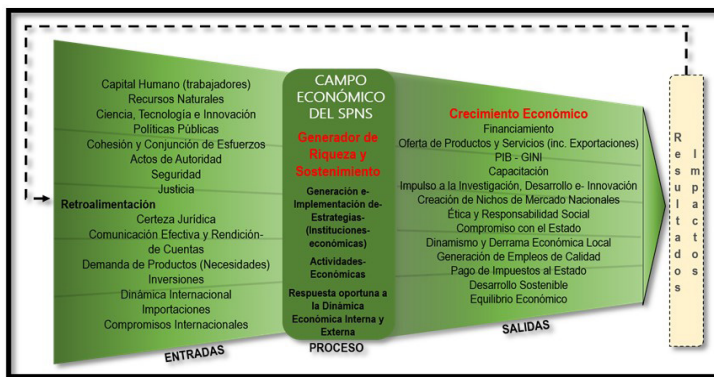
Ilustración 4. Gráfica del Proceso del Campo Económico del Sistema del Poder Nacional Sostenible