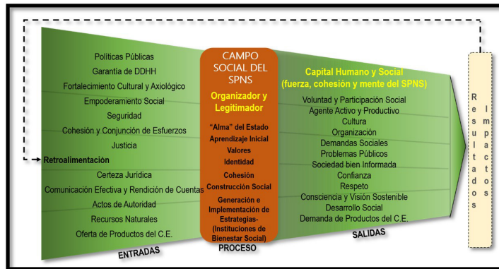
Ilustración 3. Gráfica del Proceso del Campo Social del Sistema del Poder Nacional Sostenible