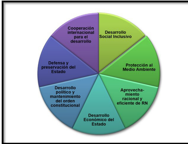
Ilustración 1. Objetivos Nacionales Permanentes Sostenibles de México