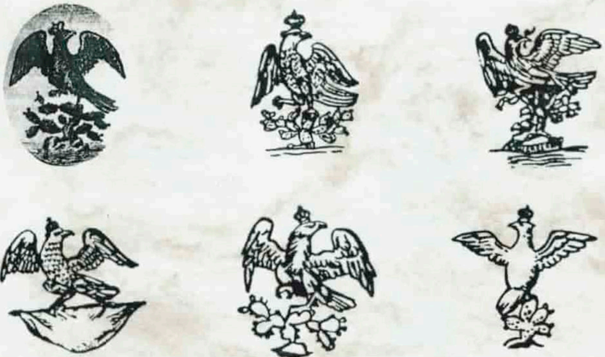
Lamina "cuatro": En este periodo la representación del escudo nacional aparece con la corona imperialista

El imperio de Agustín I duró menos de diez meses, de mayo de 1822 a marzo de 1823, cuando el levantamiento republicano de Casa Mata, que encabezó Antonio López de Santa Ana, lo obligó a abdicar y salir de territorio mexicano. El gobierno imperial, al ratificar que los privilegios de las altas clases sociales, no satisfacía las aspiraciones del pueblo mexicano ni cumplía la garantía de unión que prometiera el Plan de Iguala. Con esto el águila de la fundación de México-Tenochtitlán logró así sacudirse la corona de la dominación española que los grabadores de la época presentaron en forma caprichosa y variada. (Escudo utilizado en correspondencia oficial, por Decreto de la Junta Provisional Gubernativa del 2 de noviembre de 1821. Lámina "cuatro").