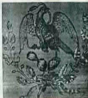
Lámina "siete": Águila reproducida en el plafón del vestíbulo del recinto de homenaje a Don Benito Juárez en el año de 1872.

Aquella mañana en que Juárez enarboló nuevamente la bandera en Palacio Nacional, el escudo mostraba un águila "destruyendo entre sus garras la corona imperial", lamentablemente no se conserva reproducción del escudo donde el símbolo del imperio ocupara el lugar de la tradicional serpiente, existe sin embargo, la representación del escudo de esa época en el recinto que habitará Benito Juárez en Palacio Nacional. (Lámina "siete").