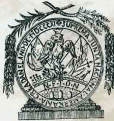
Lámina tres.- Escudo Nacional, Emblema de la Suprema Junta Nacional Mexicana Creada en el año de 1811

ejército francés. Para solemnizar sus actas, proclamas y correspondencia oficial, la Junta adoptó el Escudo de armas de Zitácuaro el 19 de agosto de 1811. El emblema presenta al águila terciada hacia la derecha y en la parte superior, ramas de laurel y encina. El ave aparece coronada sobre el puente de tres arcos que sustituye a las tres antiguas calzadas del escudo de armas de la ciudad de México. (Escudo Nacional de la Suprema Junta Nacional Americana creada en 1811. Lámina "tres").