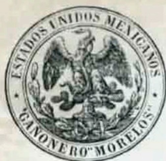
Lámina "nueve":- Diversas representaciones del escudo nacional en donde aparece el gorro frigio y es utilizado por el primer jefe del ejército constitucionalista y los tres últimos en monedas.