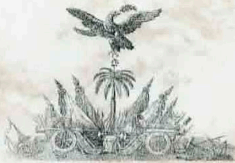
La Marina Mexicana inicia con este Emblema en donde se aprecia el sello recargado de Alegorías Departamento de Marina de Veracruz 1822