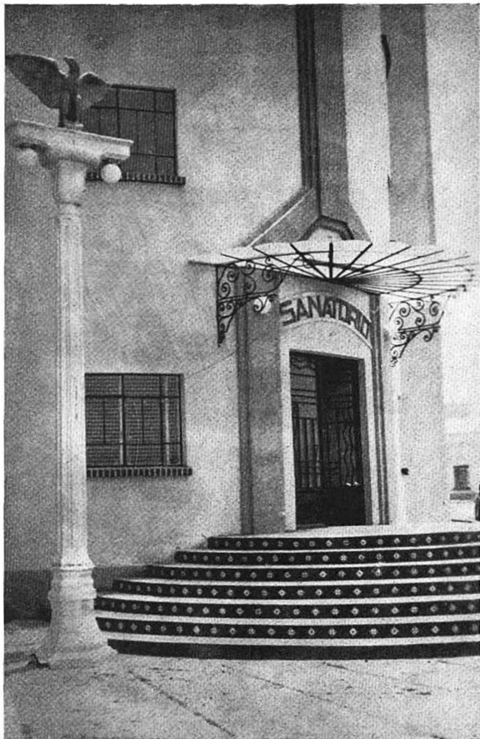
Entrada al nuevo Sanatorio.

Cinco años han pasado y el 1º de junio en curso el Sanatorio Central