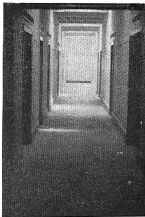
Un detalle del interior.

Sistemáticamente el Departamento Médico lleva a cabo la vacunación cada vez