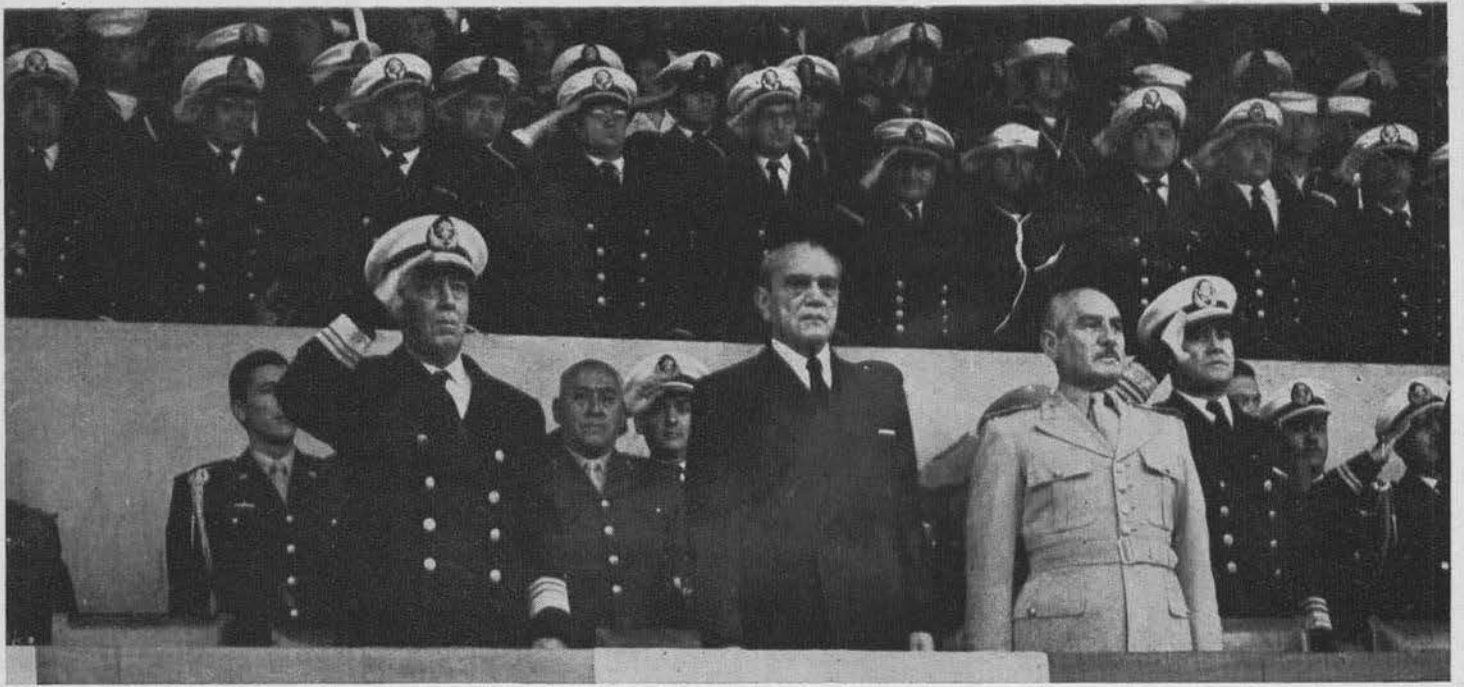
Momento solemne en la misma ceremonia, saludando a la bandera a los acordes del Himno Nacional.

tancia, y defenderla en los combates hasta alcanzar la victoria o perder la vida?”