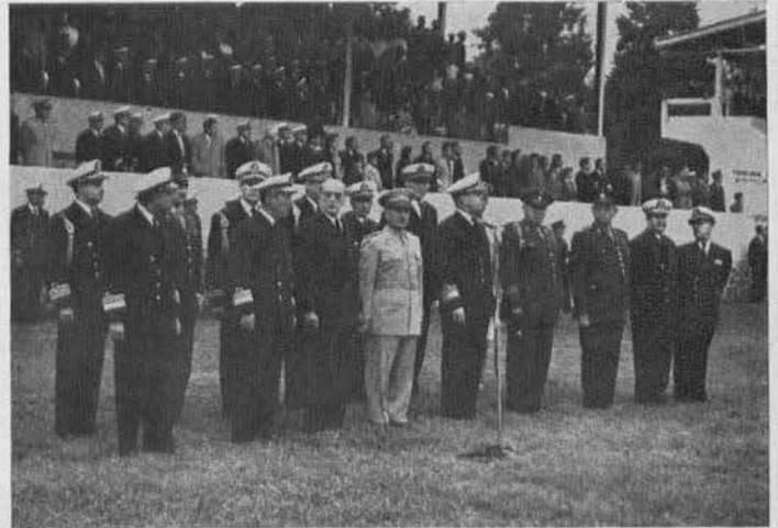
Otro acto en la ceremonia de abanderamiento en el Campo Marte.

Después de la ceremonia del abanderamiento siguió un vistoso desfile de los elementos del Servicio Militar Nacional. Ya para retirarse el Primer Mandatario del campo Marte, a los acordes del himno nacional, los conscriptos del Servicio Militar Nacional rindieron honores al Jefe de la Nación con salvas de fusilería y con los toques de sus bandas de guerra.