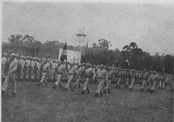
El Batallón de Infantería de Marina en el desfile el 16 de Septiembre.