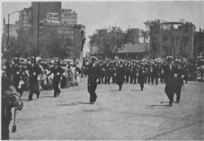
Otra vista del desfile de los Cadetes de la Escuela Náutica el 16 de Septiembre.