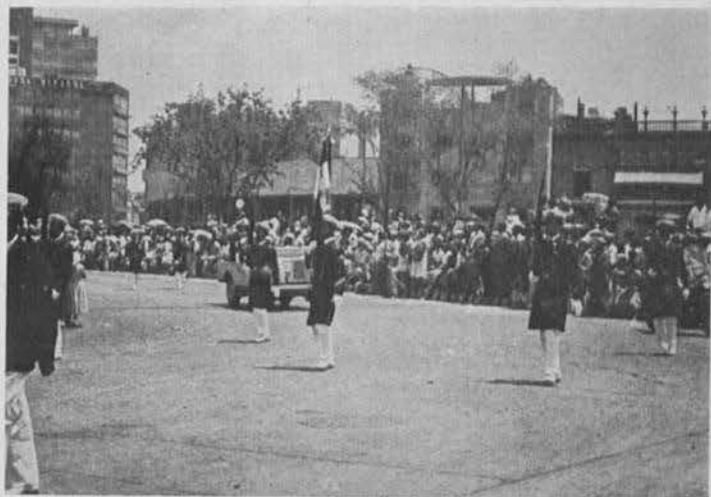
Los Cadetes de la Escuela Naval en un momento del desfile conmemorativo de nuestra Independencia.