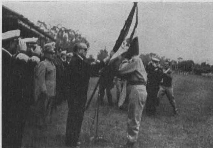
El Sr. Presidente de la República, don Adolfo Ruiz Cortines, poniendo en las manos de los subtenientes el lábaro patrio.

to y sexto batallones de infantería de Marina, del Servicio Militar Nacional: Vengo en nombre de la patria a encomendar a vuestro valor, patriotismo y estricta disciplina, esta bandera que simboliza su independencia, sus instituciones, la integridad de su territorio y su honor militar. ¿Protestais seguirla con fidelidad y cons-