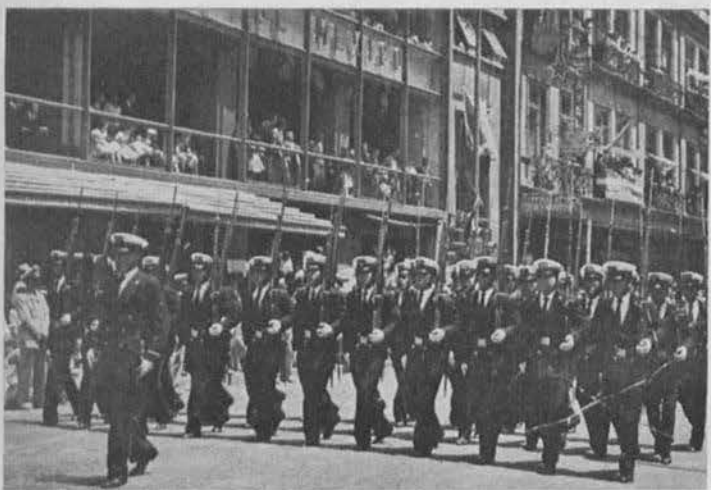
Cadetes de la Escuela Náutica en otro vistoso acto en el desfile.