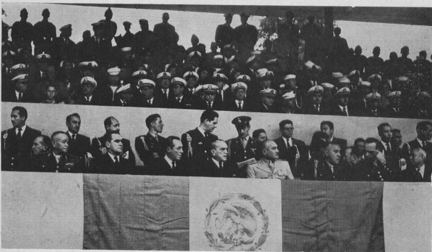
En las Tribunas del Campo Marte el Sr. Presidente don Adolfo Ruiz Cortines, en compañía del Sr. Vicealmirante don Roberto Gómez Maqueo, Secretario de Marina, y Oficiales de la Defensa, de alta graduación presiden la ceremonia del abanderamiento de contingentes de Marina.