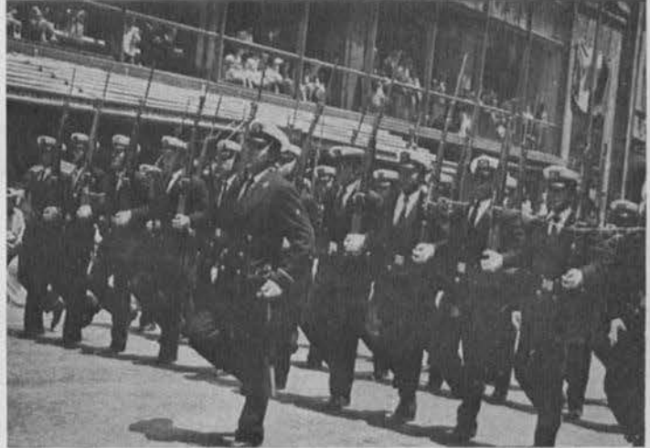
Gallarda presencia de los Cadetes de la Escuela Náutica.