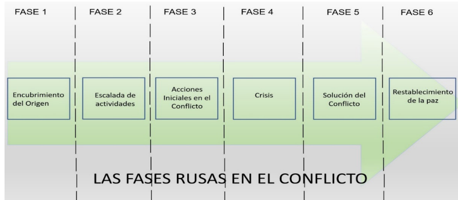
Ilustración 4. Las Fases rusas en el Conflicto de Ucrania

nario de las noticias, las operaciones cibernéticas del ejército ruso desarrollan un papel fundamental, inundando las redes sociales en Ucrania con noticias falsas, de los eventos y actividades que se desarrollaron a lo largo de la guerra, según el mayor Collins Devon Cockrell y Charles K. Bartles analistas militares han encontrado seis fases desarrolladas por las fuerzas armadas durante el conflicto.