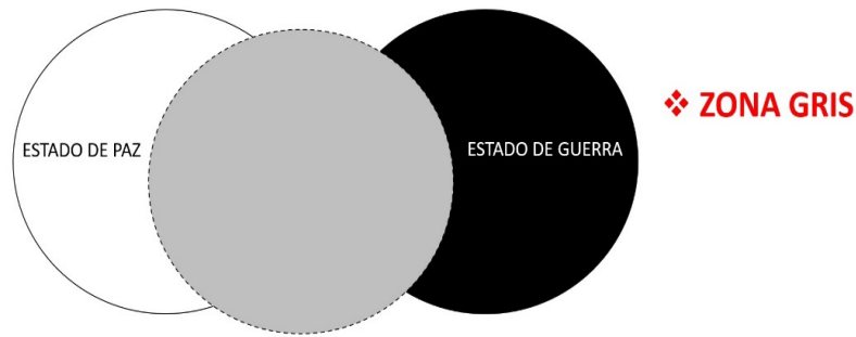
Ilustración 3 La Zona Gris

Se puede hablar de una Guerra Híbrida por la aplicación de este principio. Una vez comenzadas las hostilidades se emplearon medios híbridos para hacer la guerra contra Ucrania. Los medios híbridos se encuentran representados por la combinación de las capacidades civiles y militares para conseguir los objetivos operacionales o estratégicos de una campaña.