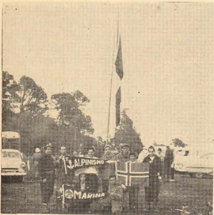
Club Alpino Marina, que se le confirió, por segunda vez, el honor de portar el lábaro patrio del Reino de Noruega.

En esta excursión como ustedes podrán ver que-