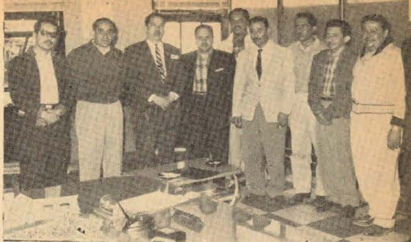
Esta fotografía fue tomada después de la elección que se llevó a cabo con los representantes del Comité Ejecutivo Nacional y del Secretario General del Coordinador de la F.S.T.S.E., en la Sección N° 2 de Tampico, Tamps.

Con motivo de los festejos del Día de la Marina durante el presente año, esta secretaría tomó activa participación en los mismos y en forma especial en la organización del baile realizado por nuestro sindicato para todos los trabajadores de esta capital y miembros de la Armada de México.