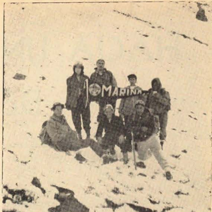
El mismo club en la ascensión de dicha confraternidad en representación de la secretaria del ramo, en el cráter del volcán del Popocatepetl.

daron consolidadas las relaciones internacionales que existen del Reino de Noruega para con nuestro país.