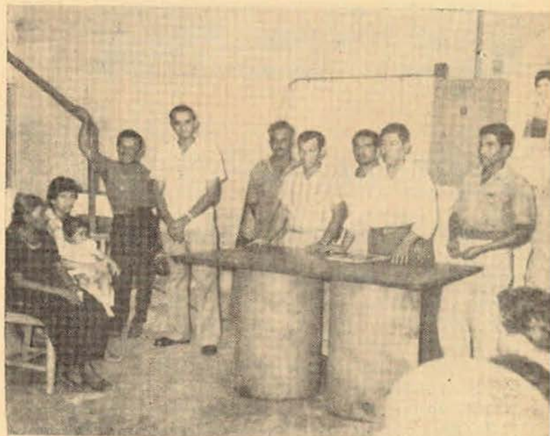
Fotografía tomada después de haber sido entregados los cheques a cada una de las beneficiarias por el C. Secretario General de la Sección No. 9, Astillero de Marina en Coatzacoalcos, Ver. Marzo 1961.

REHABILITACION. —En este aspecto hemos logrado que por mediación de la Secretaria de Marina, el Instituto Nacional de Rehabilitación dé tratamiento externo y aparatos ortopédicos a trabajadores y sus familiares, tanto foráneos como del Distrito Federal, afortunadamente pocos casos hemos tenido pero todos han sido resueltos favorablemente.