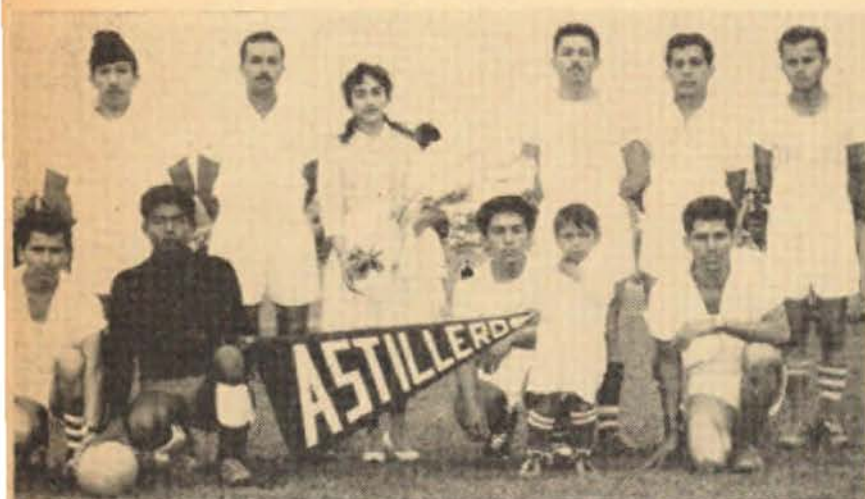
Club de futbol compuesto por los compañeros de la Sección No. 1 de Tampico, Tamps., quienes resultaron campeones de liga.