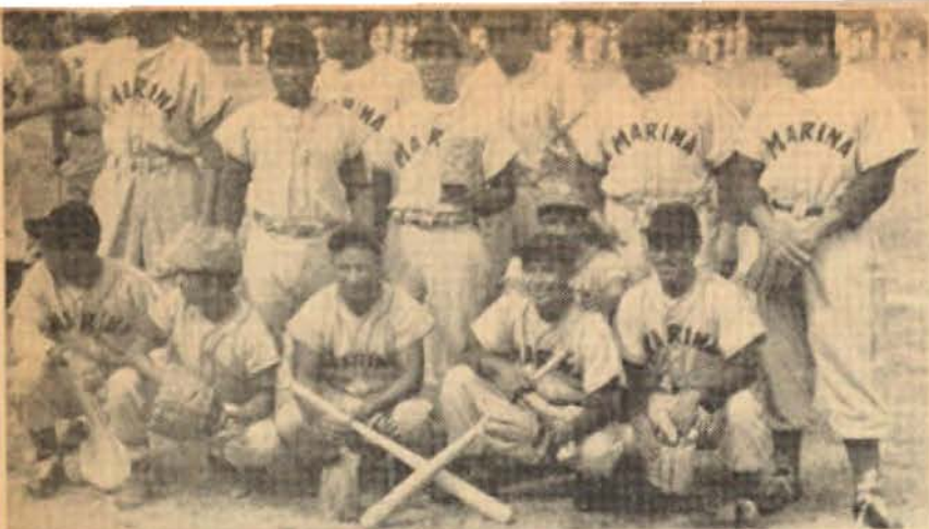
Equipo de beisbol Secretaría de Marina subcampeones de 1a. fuerza de liga en 1960, integrados por los compañeros de la Sección No. 16 de Acapulco, Gro.