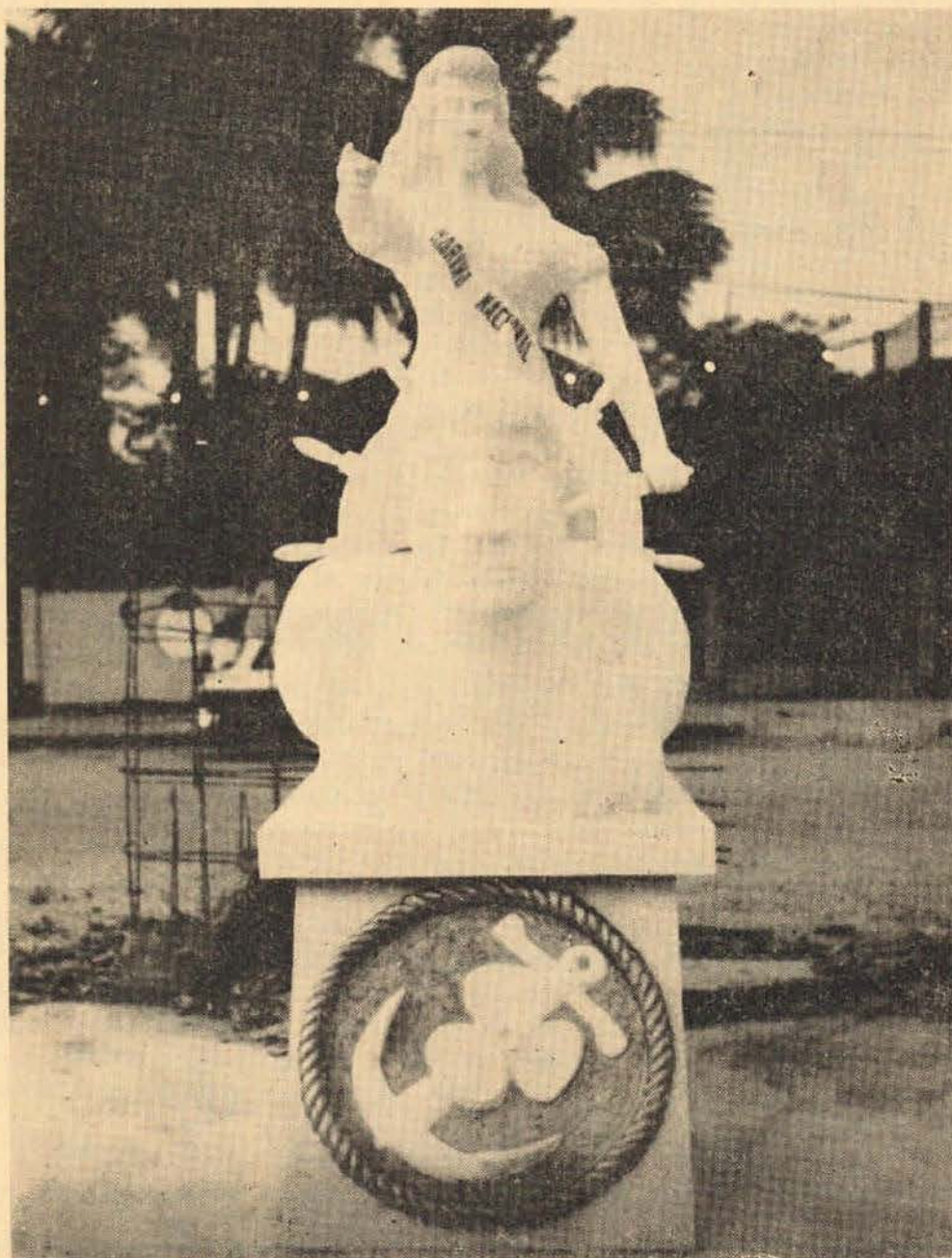
Monumento instalado en el centro del muelle de cabotaje en el puerto fluvial de Minatitlán, Ver., e inaugurado el 1° de junio del presente año, como número principal de los festejos del Día de la Marina Nacional.