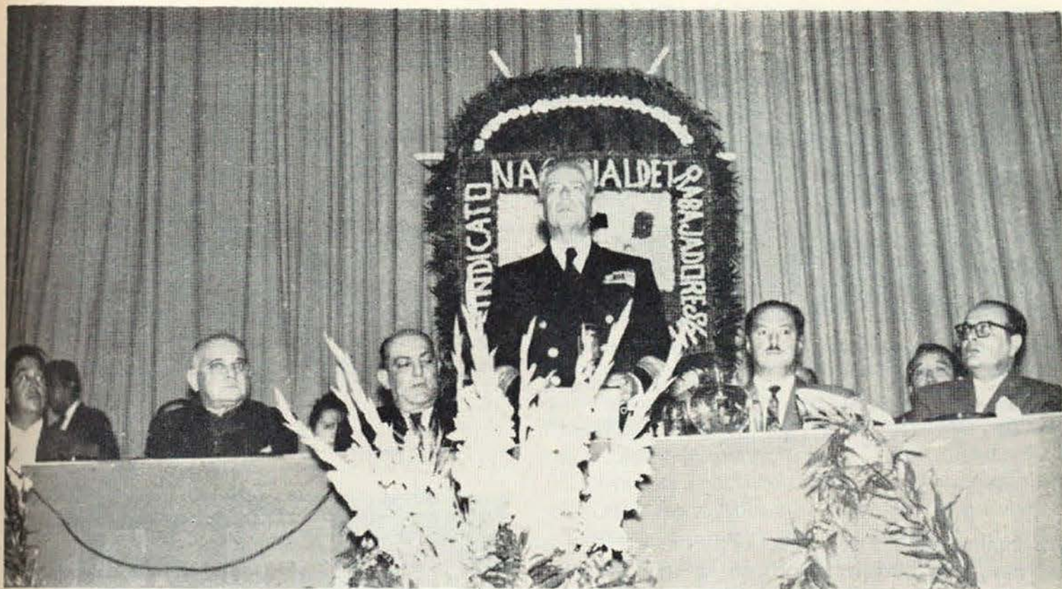
El Sr. Almirante C. G. Manuel Zermeño Araico, Secretario de Marina, en nombre y representación del C. Lic. Adolfo López Mateos, Presidente de la República, declara debidamente inaugurada nuestra X Gran Convención Nacional Ordinaria, el 26 de septiembre pasado en el "Teatro Juárez" del Sindicato hermano de la Secretaría de Salubridad y Asistencia.

con los de este continente, se formaron los grupos que más tarde dieron a nuestro conglomerado lo inesperado, que al parecer no existía y así fue como en un arranque de ideal que iniciara nuestro ancestro MIGUEL HIDALGO Y COSTILLA, nos legó un Pueblo y una Patria que se independizó de aquel continente; por lo tanto la iniciación de nuestra