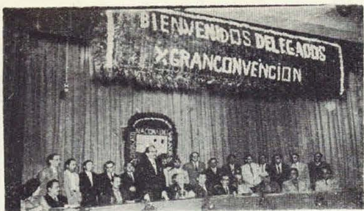
Fotografía del Presidium de nuestra X GRAN CONVENCION NACIONAL ORDINARIA, celebrada del 26 al 28 de septiembre pasado. En uso de la palabra el compañero representante ante la Convención del Sindicato Nacional de Trabajadores de la Secretaría de Salubridad y Asistencia.