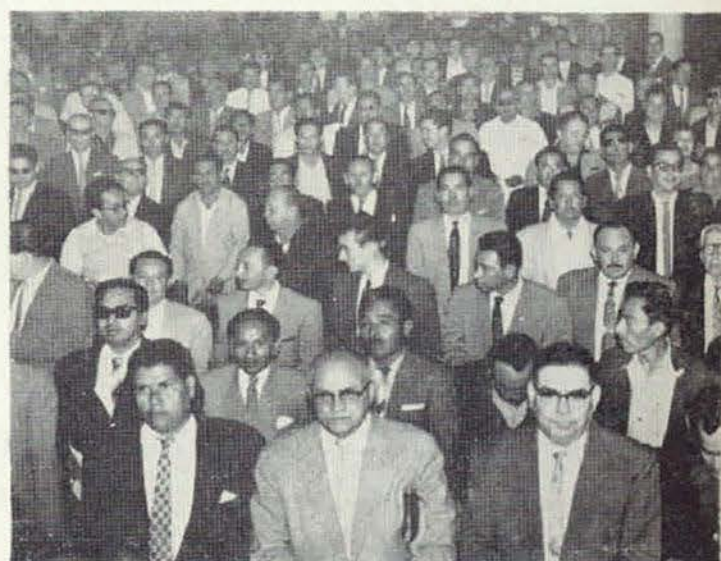
Dos aspectos de los compañeros Delegados que asistieron a nuestra X Gran Convención Nacional Ordinaria. Estas fotos corresponden al día 26 de septiembre último, en que se instaló la Convención.

Una gran satisfacción siente mi ser al verme en grupo unido a todos ustedes y ustedes en estos momentos me han demostrado la satisfacción que