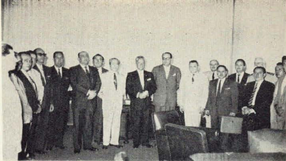
El actual Comité Ejecutivo Nacional haciéndole presentes sus respetos y colaboración al Sr. Secretario de Marina, quien se encuentra acompañado de los Sres. Subsecretario, Oficial Mayor, Directores de Marina Mercante, de Obras Marítimas, de Construcción Naval, de Cuenta y Administración y del Jefe del Departamento Médico.

En el transcurso de esta visita, puesto que fue una visita cordial entre autoridades y sindicato, se cruzaron frases de afecto y respeto entre nuestro Secretario General y el señor Secretario de Marina,