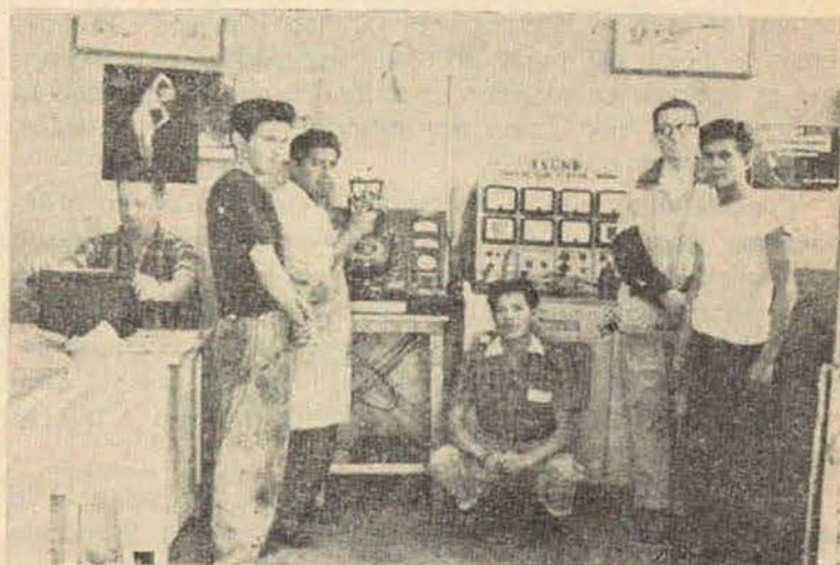
LABORATORIO DE AFINACION AUTOMOTRIZ

Colaborar en el rolado de tubería para Dragas, acarreo de láminas para la construcción de lanchas metálicas, transportar maquinaria del Almacén Gral., al almacén de estos talleres, colaborar en los trabajos de fundición de piezas pesadas y cuanta maniobra se solicita para dependencias de la Secretaría del Ramo.