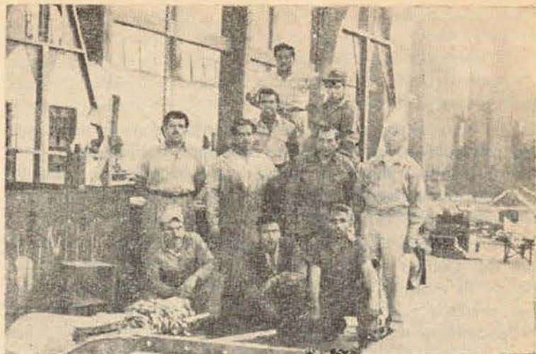
TALLER DE MOLDEO Y FUNDICION

Bajo su vigilancia se han llevado a cabo los trabajos de construcción de lanchas metálicas de 16.50 y 17 metros de eslora, destinadas a Patrullas y al servicio de la Armada de México.