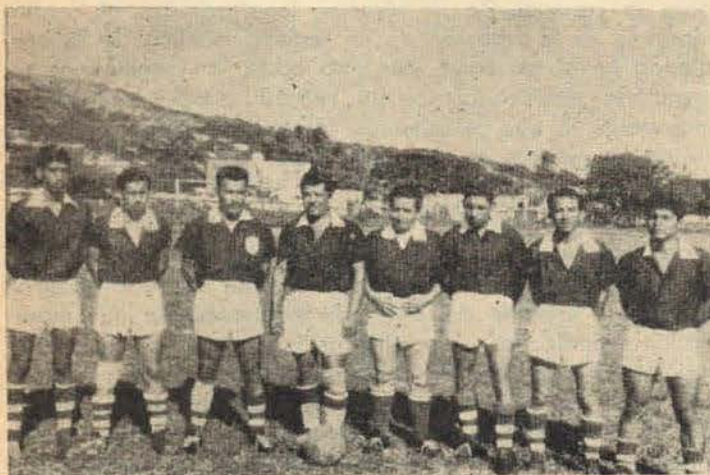
Oncena futbol "Dique Seco". Sección 15. Tierra. Sind. Marina.

Por las facilidades que prestan a nuestros compañeros las autoridades de ese centro de trabajo, por medio de estas líneas el Comité Ejecutivo Nacional de los Trabajadores de la Secretaría de Marina les dan las más cumplidas gracias, y a las autoridades superiores de la propia Secretaría de Marina, especialmente al C. Oficial Mayor, les agradecemos sus valiosos acuerdos para que se suministre lo necesario para el desarrollo y fomento del deporte entre nuestros agremiados en general, ya que así nuestros compañeros rendirán más en sus labores encomendadas, por encontrarse bien preparados físicamente y alejados de otras actividades nocivas a su salud.