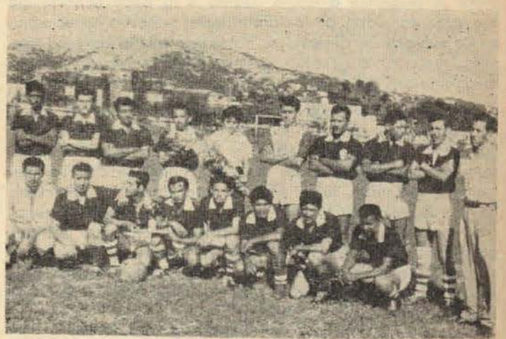
Oncena futbol "Dique Seco". Sección 15. Sria. de Marina.

El Comité Ejecutivo Nacional de nuestro Sindicato, a través de su Secretaría de Educación y Fomento Deportivo, hace patente su agradecimiento al C. Oficial Mayor y demás autoridades de la Secretaría de Marina por las atencio-