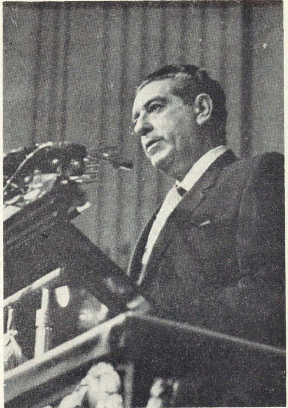
El C. Lic. Adolfo López Mateos hace patente el esfuerzo de su gobierno al rendir, a México y al mundo entero, el informe de su actuación en el primer año de labores.

Se realizan en 18 puntos litorales; figuran entre ellas las del astillero muelle de metales en Tampico; el canal de navegación Tampico-Tuxpan en el tramo Tampamachopo-Tanhuijo; el edificio para el astillero de Coatzacoalcos, las escolleras de Tuxpan, Frontera, al noroeste de Veracruz y al