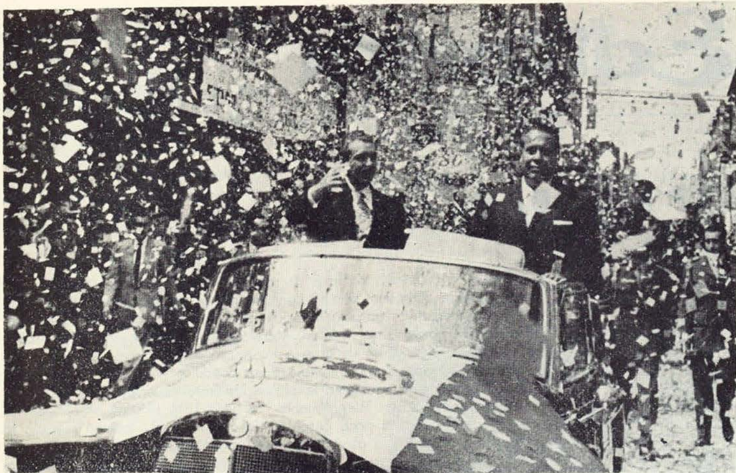
El Primer Mandatario de la Nación recibe los vítores del pueblo de México, cuando se dirige a la Cámara de Diputados a rendir su Primer Informe.