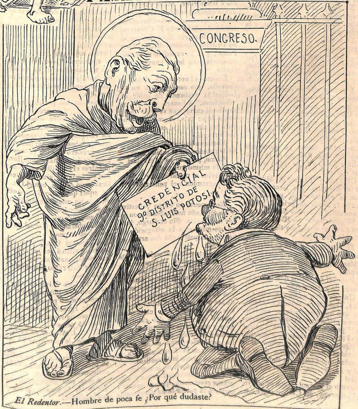
El Redentor.—Hombre de poca fe ¿Por qué dudaste?