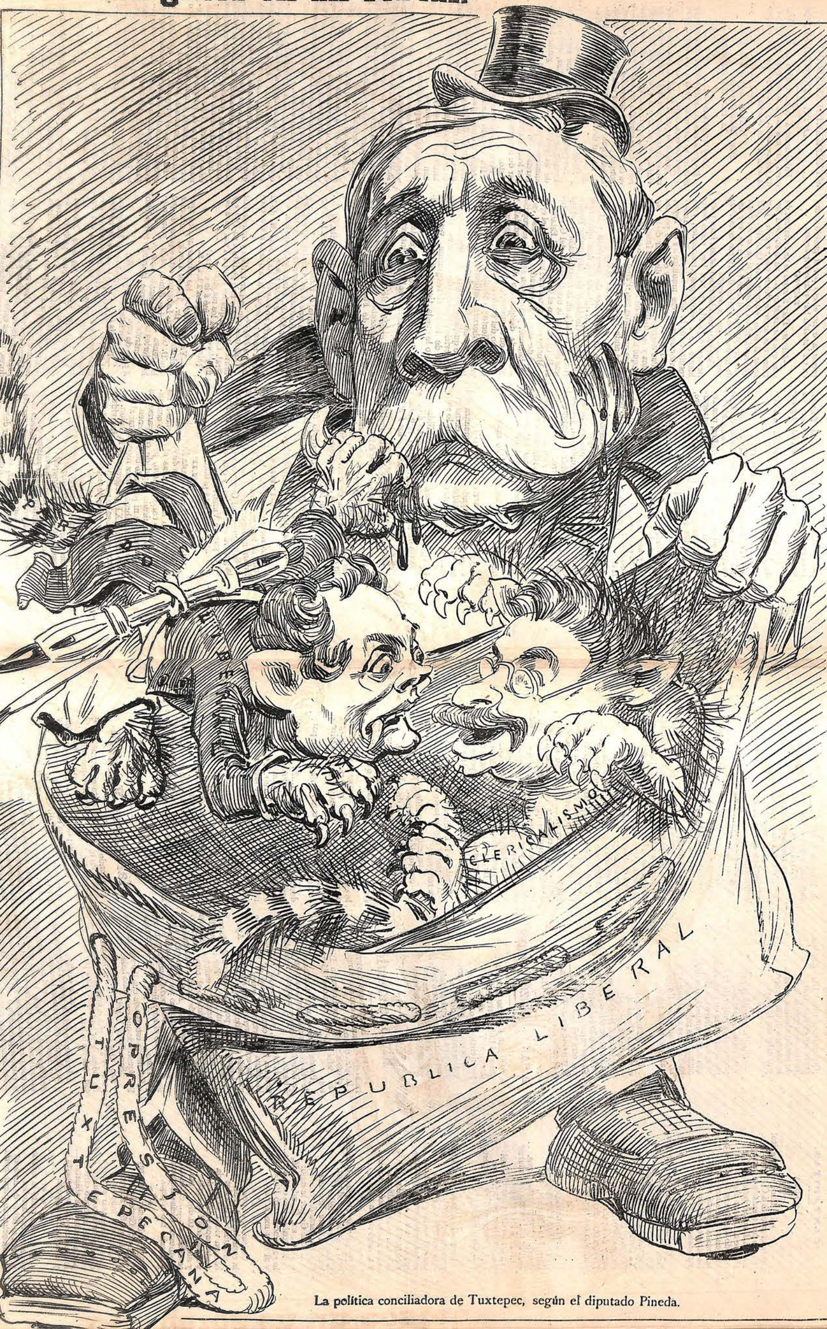
La política conciliadora de Tuxtepec, según el diputado Pineda.