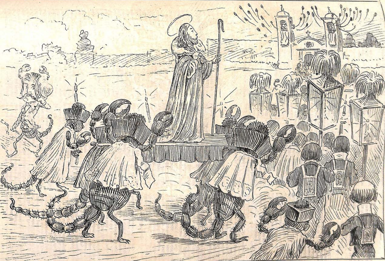
La procesión del Divino Pastor