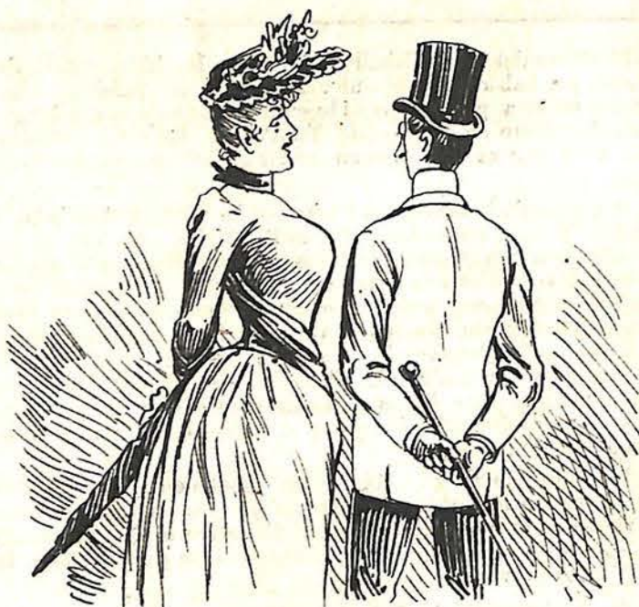
EN UNA EXPOSICIÓN.

—Con franqueza, ¿qué te gusta más? —Ingenuamente ¡lo que más me gusta son las aperturas!