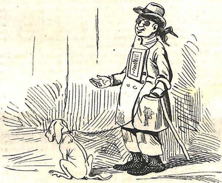
UN BUEN DESEO.

—No dejaría de causar sensación si me presentara vestida de Eva. —Entonces me permitiría Vd. en obsequio á la moral, que yo hiciera de hoja de parra.