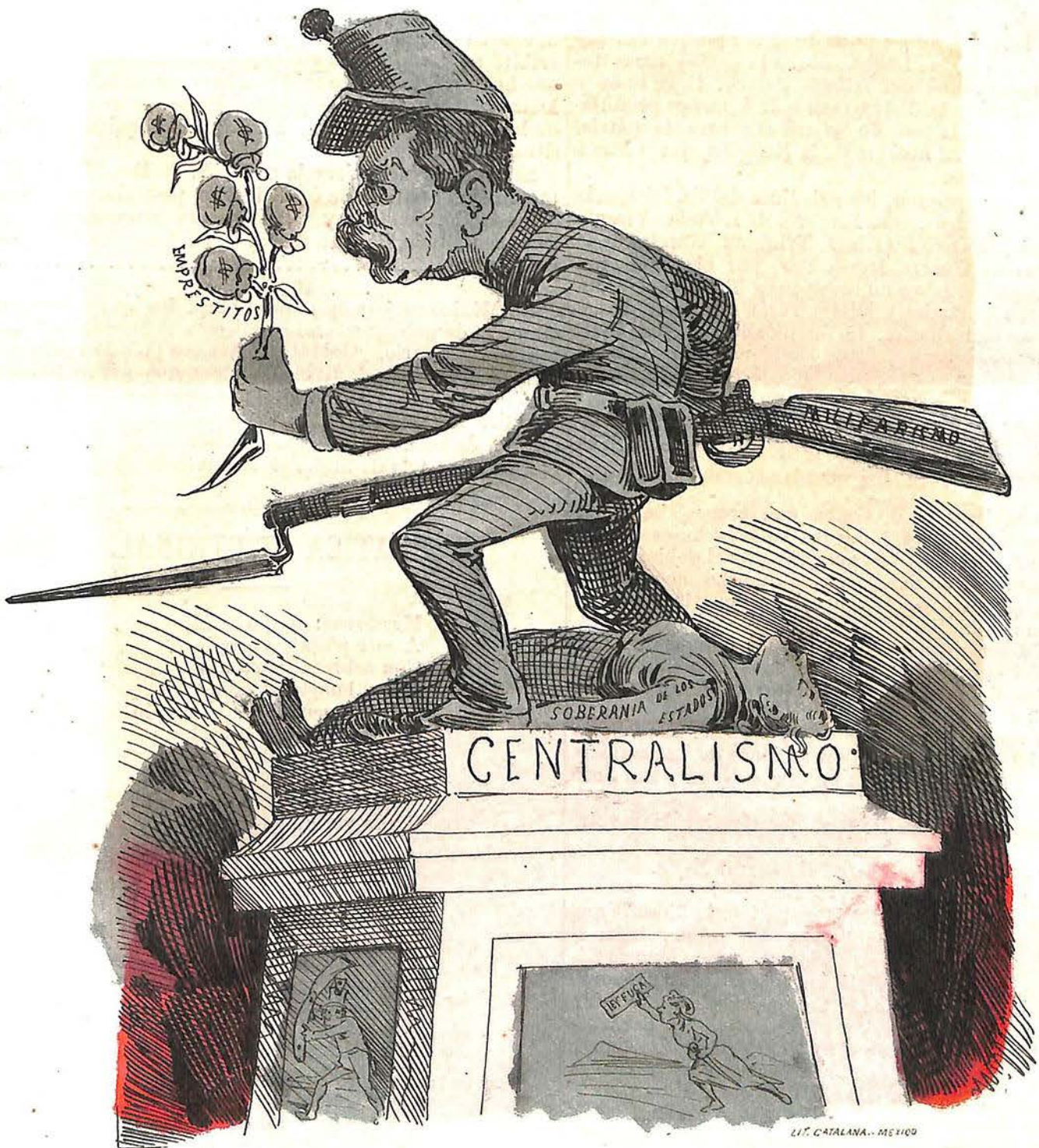
Proyecto de estatua para coronar el proyectado monumento del circulo amistoso.