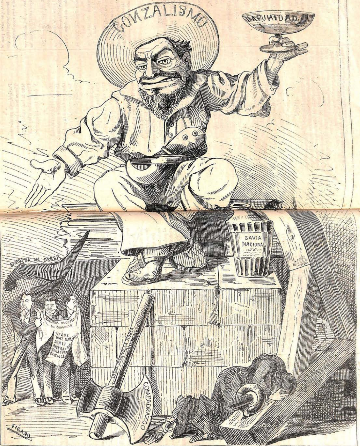
CUADRO CONMEMORATIVO EN RECUERDO DEL AÑO DE 1885.

La Justicia, por el suelo; La minoría sin hablar;