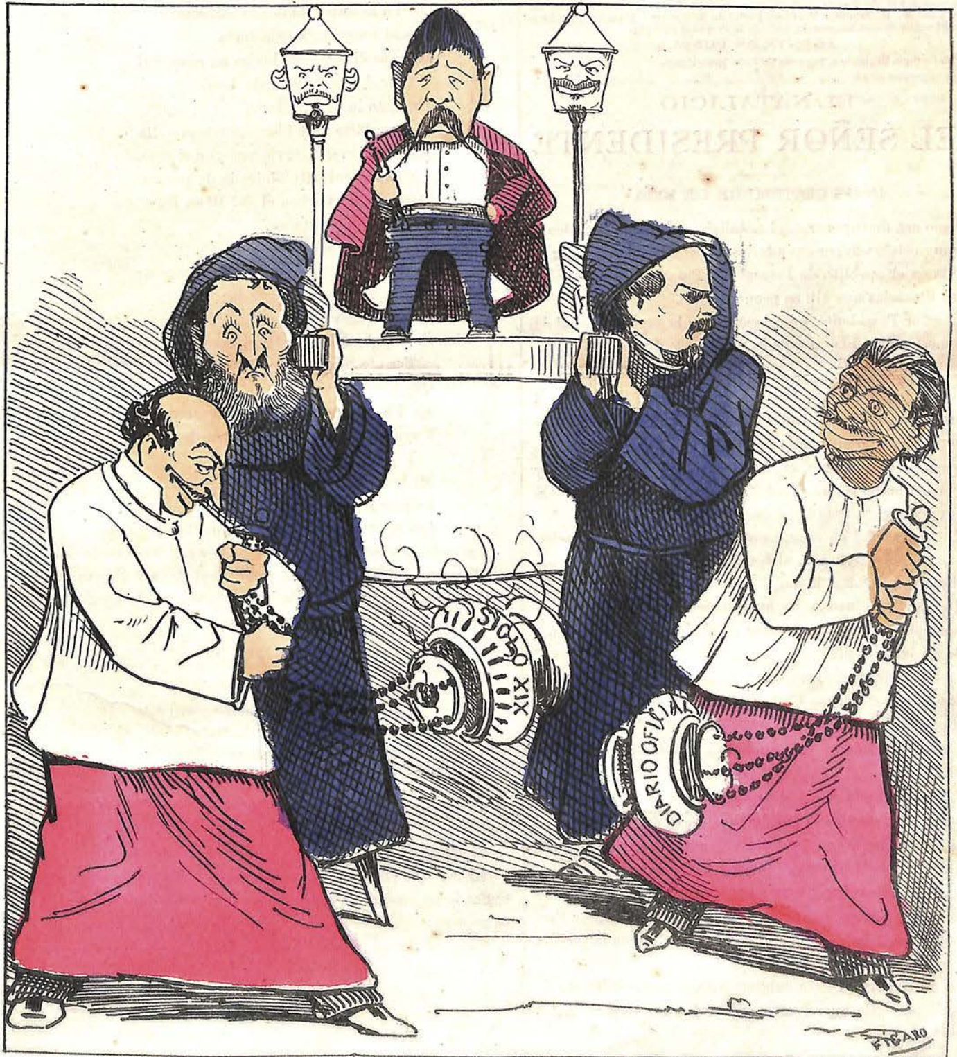
¡Qué guapo está el Sacarreal Cuando sale en procesión!.... Sólo le falta un misal En vez de Constitución.